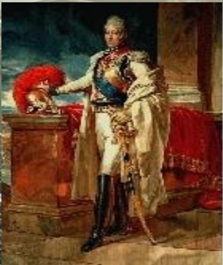
Карл X (1824-1830)

Человек легкомысленный и упрямый, не слишком склонный к наукам. Он обещал стать королем эмигрантов и стал им. С каждым годом он все более возвращался к старым порядкам.