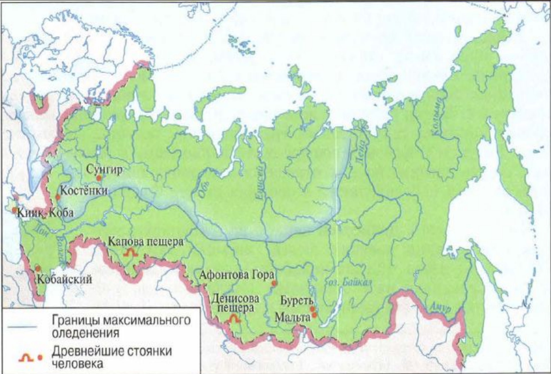
Территория России в древности