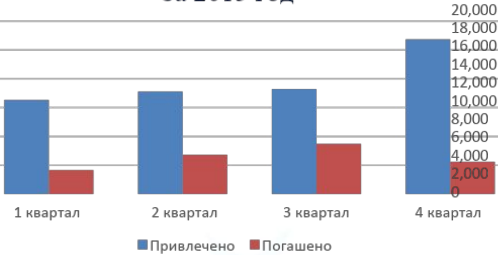
За 2015 год

В 2015 году: привлечено – 15,843 млрд $ погашено – 5,064 млрд $ ( задолженность российских хозяйственных обществ перед кредиторами )