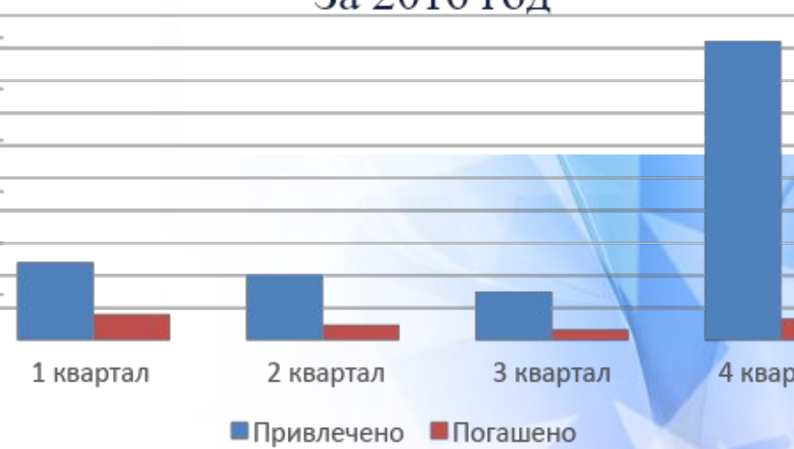
За 2016 год

В 2016 году: привлечено – 30,332 млрд $ погашено – 4,595 млрд $ ( задолженность российских хозяйственных обществ перед кредиторами )