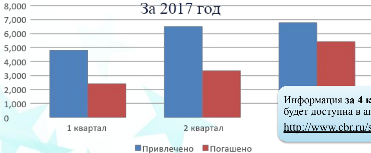
За 2017 год

Информация за 4 квартал 2017 года будет доступна в апреле 2018