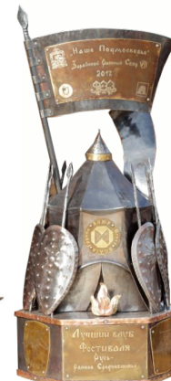
Кубок 2017 г.