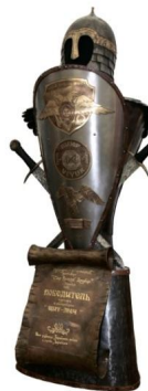
Кубок 2013 г.