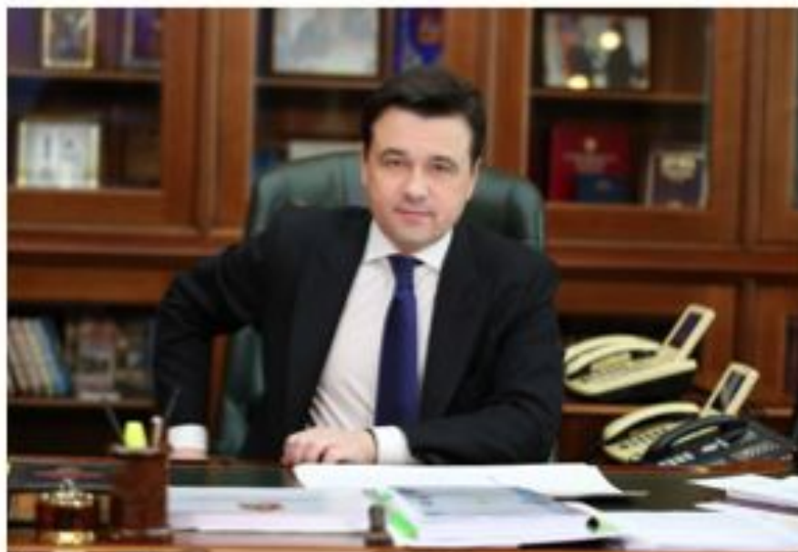
Андрей Юрьевич Воробьев Губернатор Московской Области