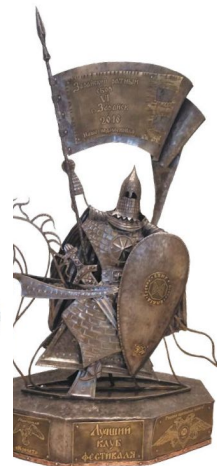
Кубок 2016 г.