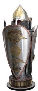
Кубок 2012 г.