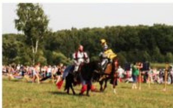
Бугурты. Мечевой бой. Один на один и пять на пять