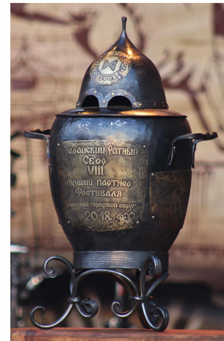
Кубок 2018 г.