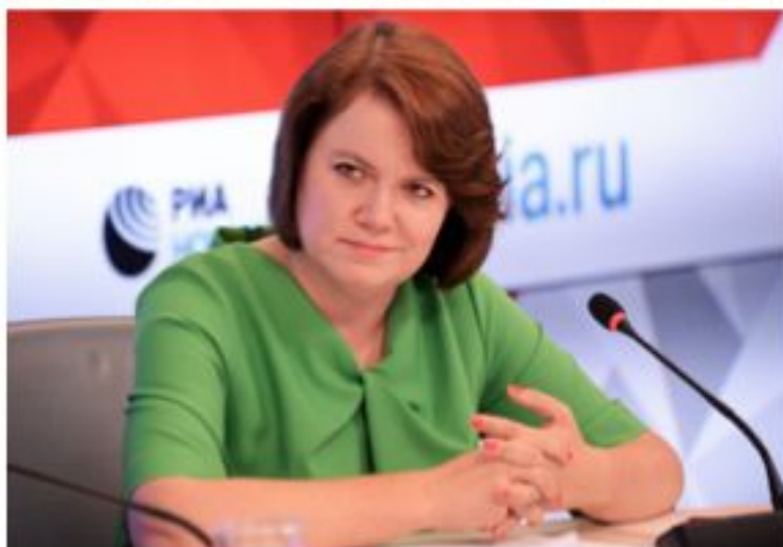
Оксана Валентиновна Косарева Министр культуры Московской области