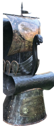
Кубок 2015 г.