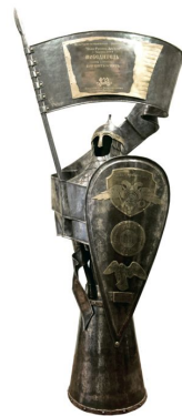
Кубок 2014 г.