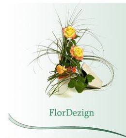
Букеты и флористические композиции

ФОТОГРАФИИ ОБРАБОТАННЫЕ НА ФИРМЕННОМ ИЛИ БЕЛОМ ФОНЕ