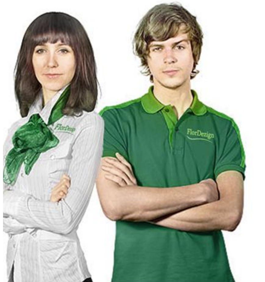
Фирменная одежда продавцов