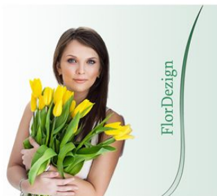
Люди с букетами цветов и композиций

ФОТОГРАФИИ ОБРАБОТАННЫЕ НА ФИРМЕННОМ ИЛИ БЕЛОМ ФОНЕ