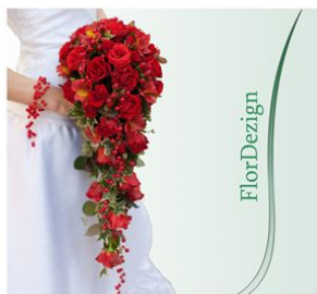
Люди с букетами цветов и композиций

ФОТОГРАФИИ ОБРАБОТАННЫЕ НА ФИРМЕННОМ ИЛИ БЕЛОМ ФОНЕ