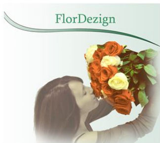
Люди с букетами цветов и композиций

ФОТОГРАФИИ ОБРАБОТАННЫЕ НА ФИРМЕННОМ ИЛИ БЕЛОМ ФОНЕ