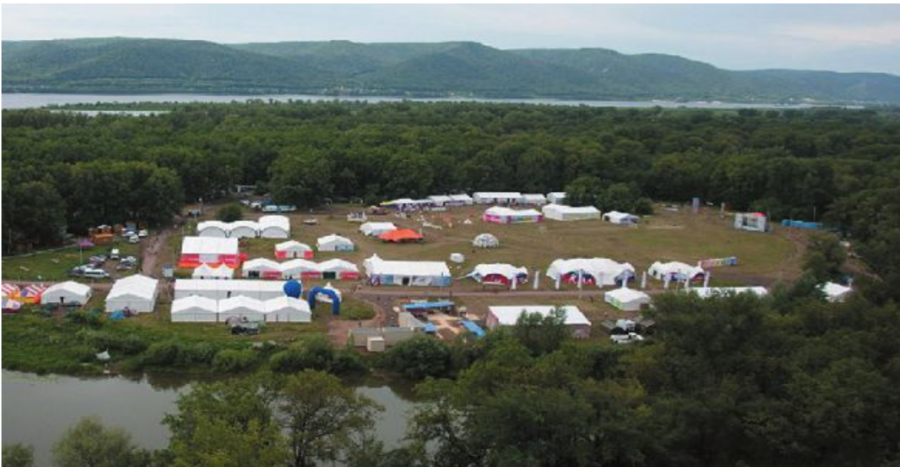
Самарская область, Фестивальная поляна