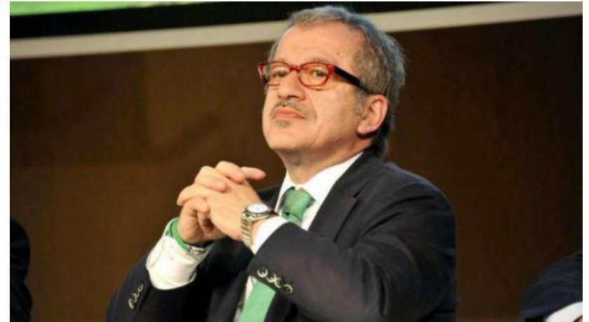
Министр внутренних дел Италии Роберто