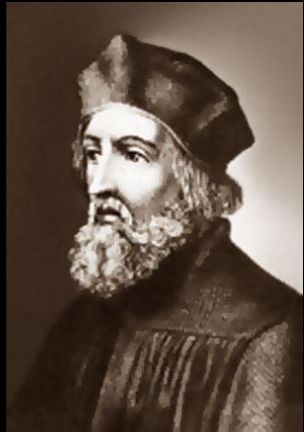
Ян Гус (1371-1415 гг.)