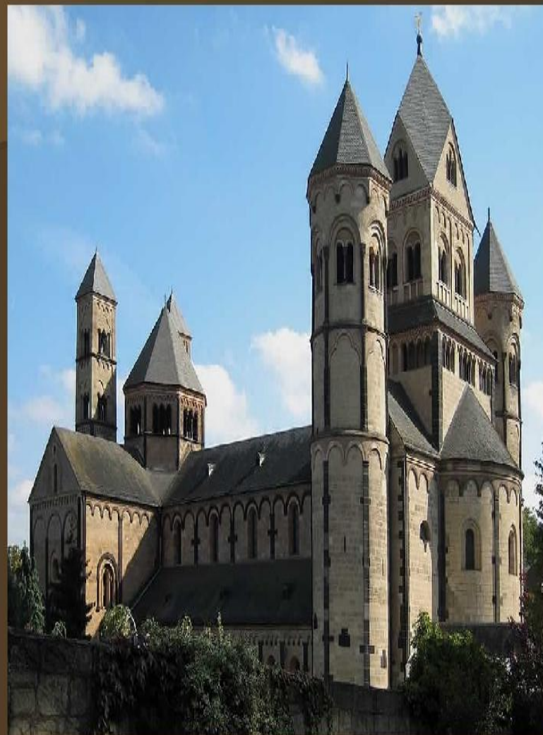
Собор святых Марии и Николая Лаахского аббатства. Германия. 1093 – 1355 гг.

СУЩЕСТВЕННОЙ ХАРАКТЕРИСТИКОЙ РОМАНСКОГО СТИЛЯ БЫЛА ЕГО УНИВЕРСАЛЬНОСТЬ – ЭТОТ СТИЛЬ ХАРАКТЕРИЗУЕТ И СВЕТСКИЕ, И РЕЛИГИОЗНЫЕ ПОСТРОЙКИ. ЦЕРКВИ, ЗАМКИ, МОНАСТЫРСКИЕ КОМПЛЕКСЫ РАСПОЛАГАЛИСЬ НА ВОЗВЫШЕННОСТИ, ГОСПОДСТВУЯ НАД ОКРУЖАЮЩИМ ПЕЙЗАЖЕМ. МОЩНЫЕ СТЕНЫ, УЗКИЕ ОКНА, ПРОПУСКАЮЩИЕ НЕМНОГО СВЕТА, ПОДЧЕРКИВАЛИ ТО, ЧТО РОМАНСКАЯ ПОСТРОЙКА ВНЕ ЗАВИСИМОСТИ ОТ ЕЕ НАЗНАЧЕНИЯ – ЭТО ПРЕЖДЕ ВСЕГО КРЕПОСТЬ.