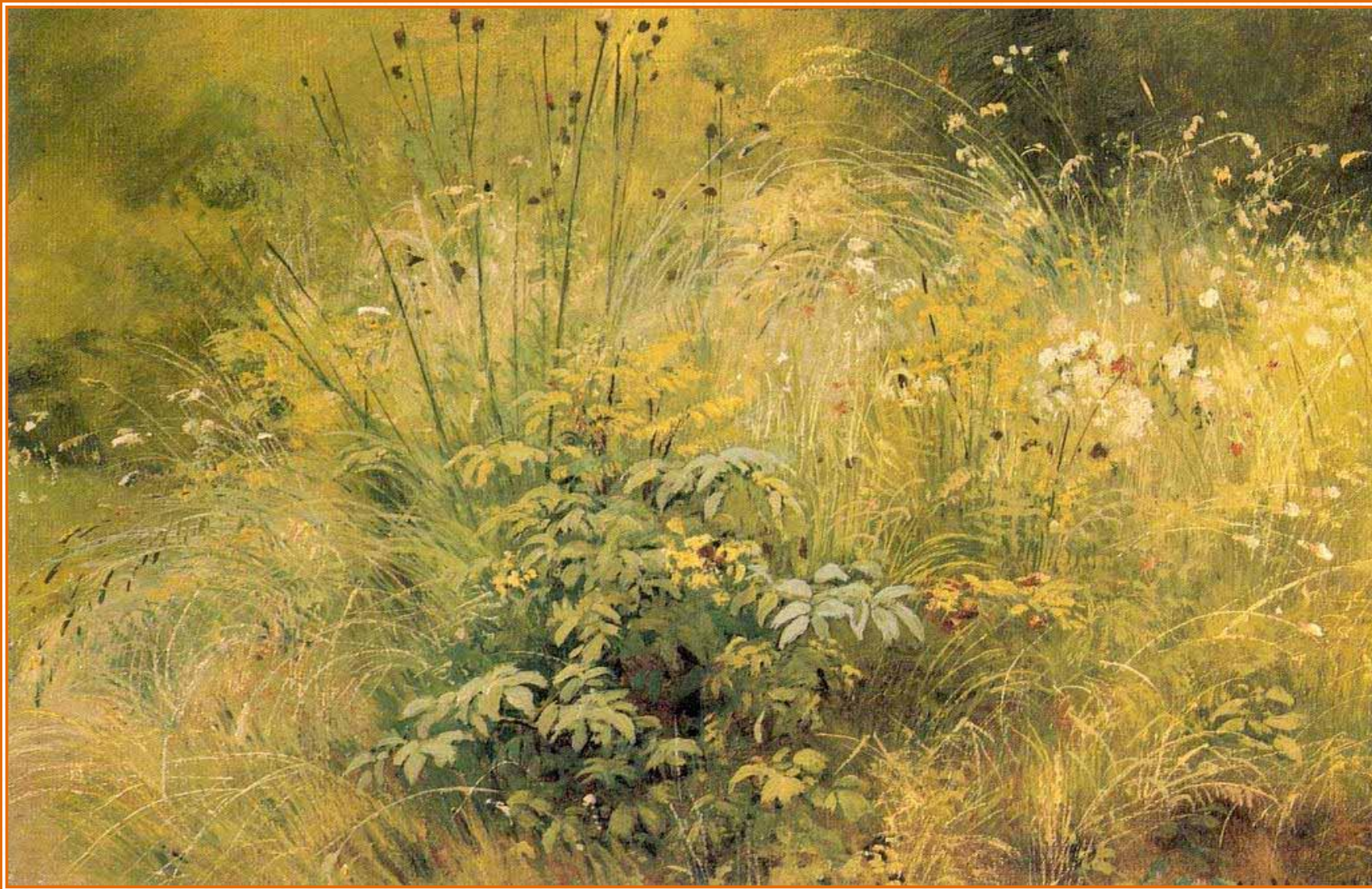
И. Шишкин «Травы»