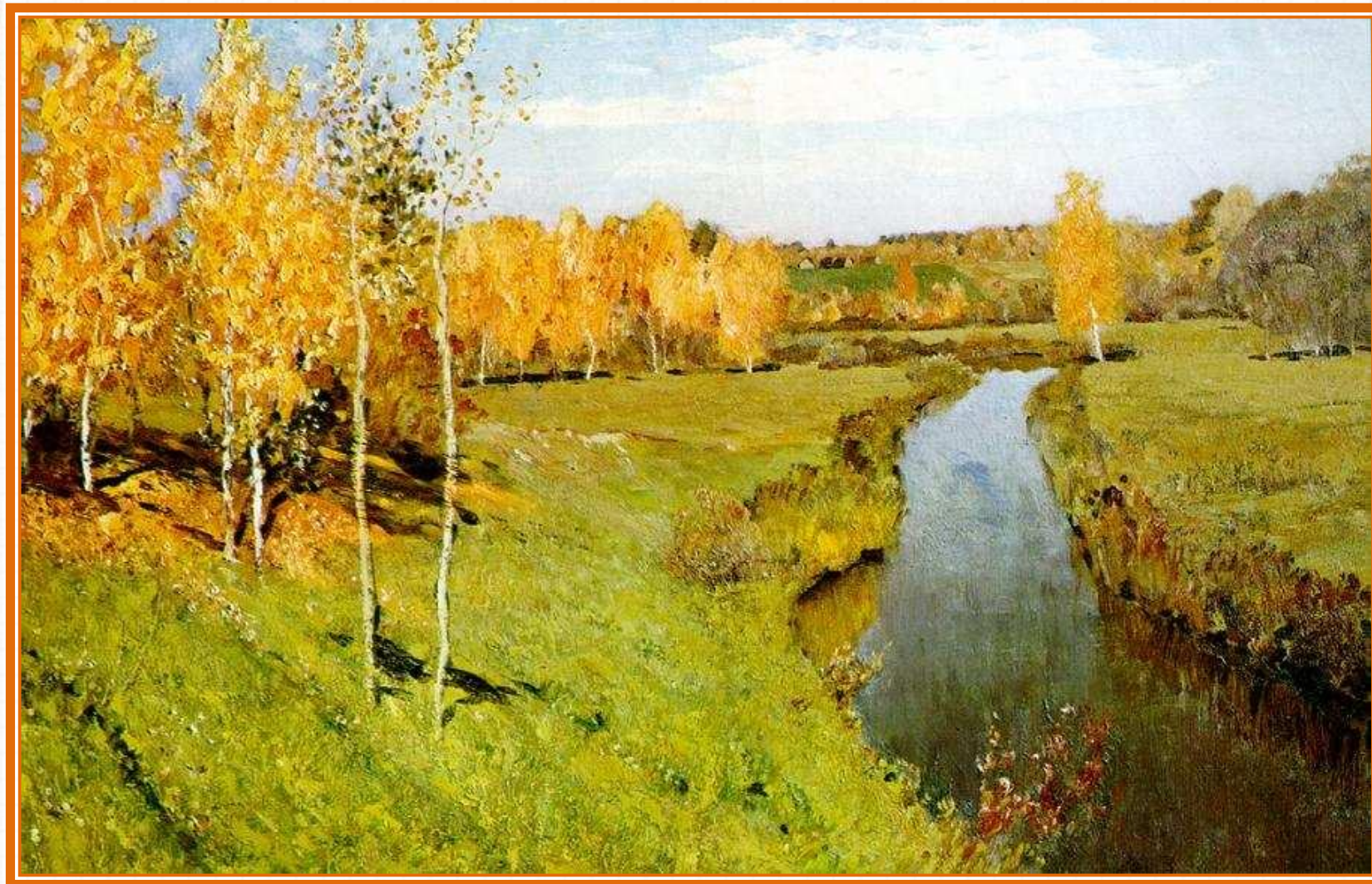
И. Левитан «Золотая осень»

Выдели «участие» каждого Мастера в работах художников.