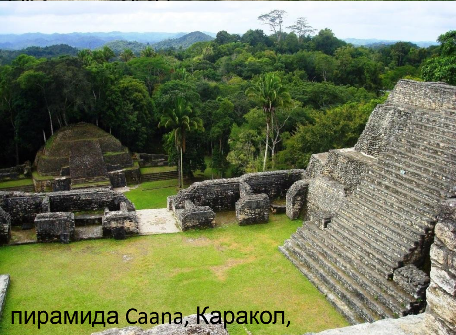
пирамида Саана, Каракол,