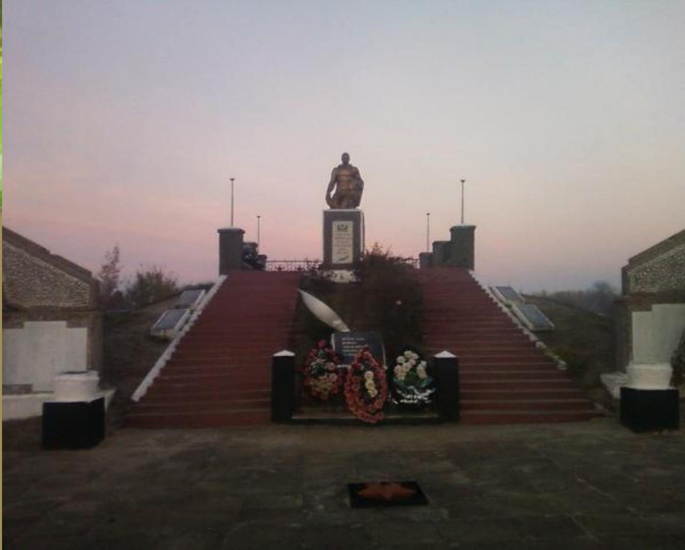
Братська могила, іменована «Парком слави»