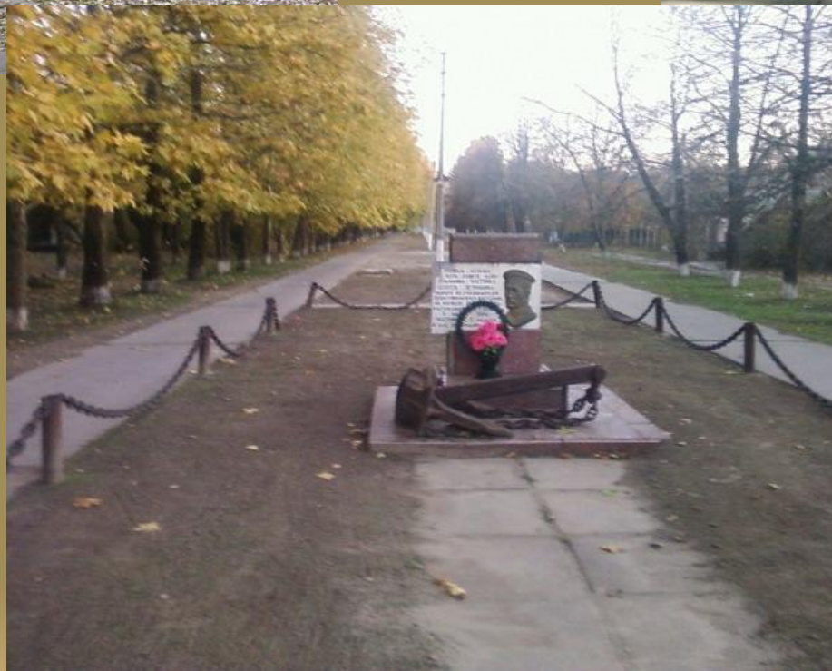
Алея ім. С.П. Часника