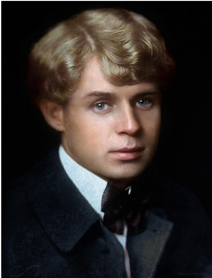
Сергей Александрович Есенин ( 1895 - 1925 гг )