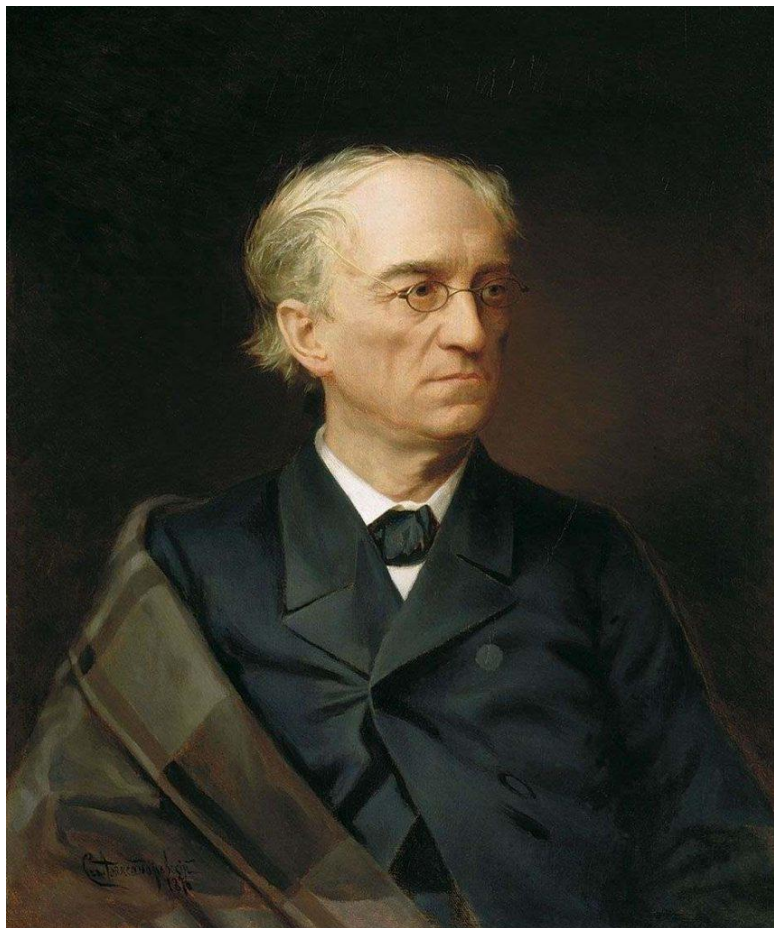
Фёдор Иванович Тютчев ( 1803 - 1873 гг )