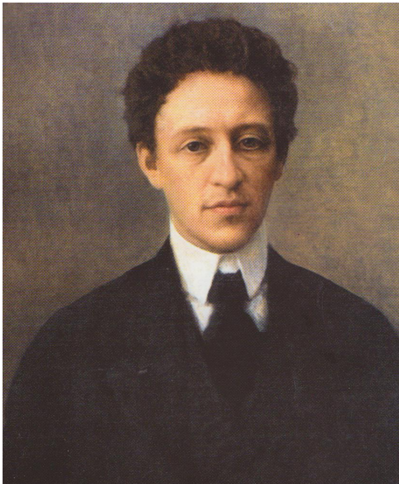
Александр Александрович Блок ( 1880 - 1921 гг )