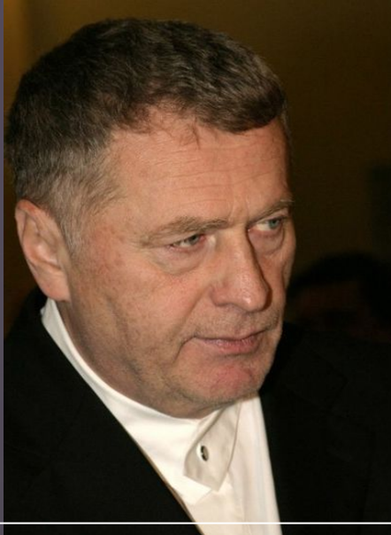
Владимир Вольфович Жириновский

Радикальная партия, выступающая за сильное государство, которому должны быть подчинены интересы всех его граждан.