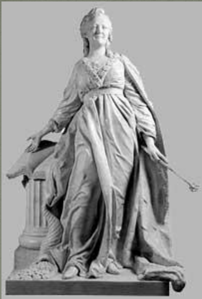
Мраморная скульптура Екатерины II работы Ф.И. Шубина