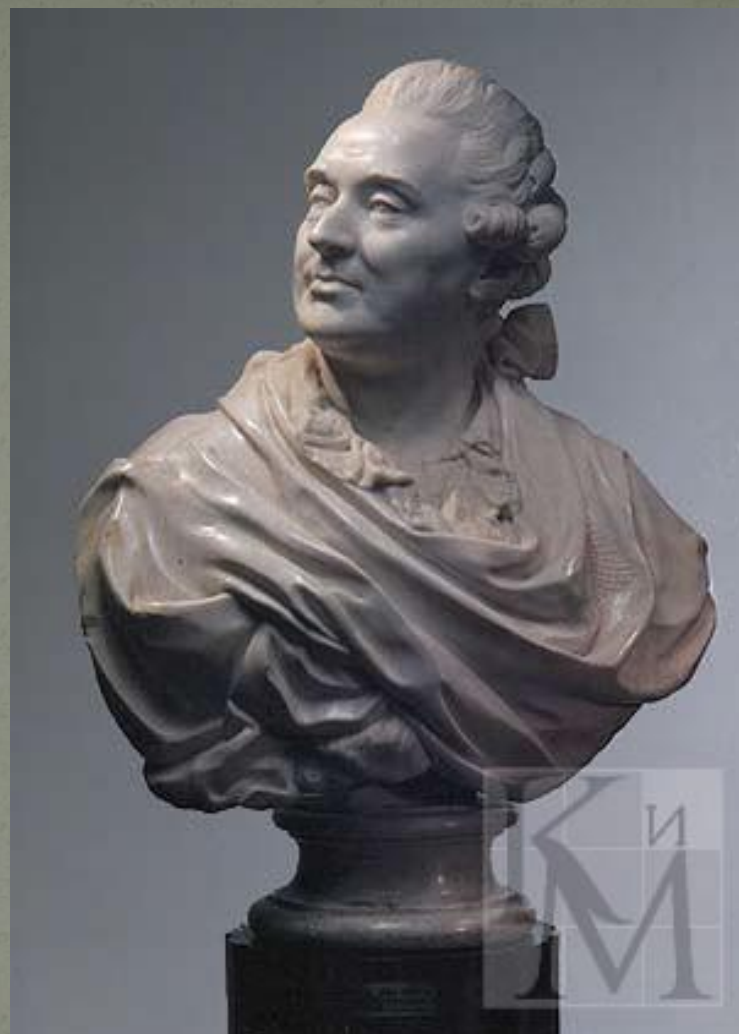
ШУБИН Федот Иванович Бюст А. М. Голицына