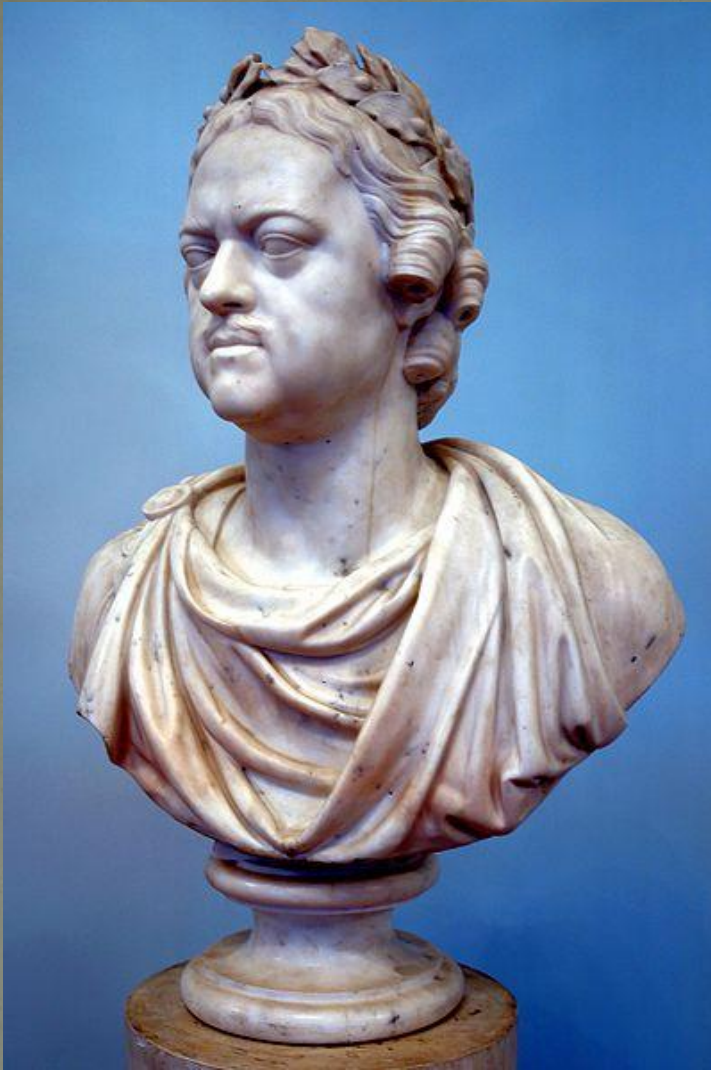
Бюст Петра I.