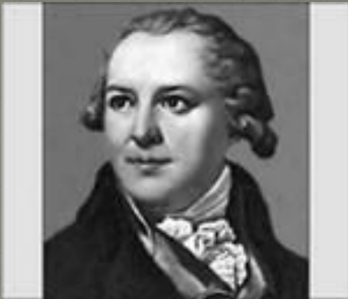
Шубин Федор Иванович (1740 – 1805)