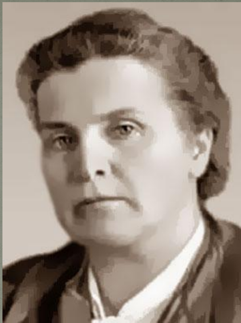
Вера Игнатьевна Мухина (1889 – 1953)