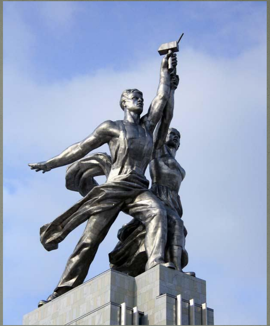
Мухина В.И. Рабочий и колхозница.