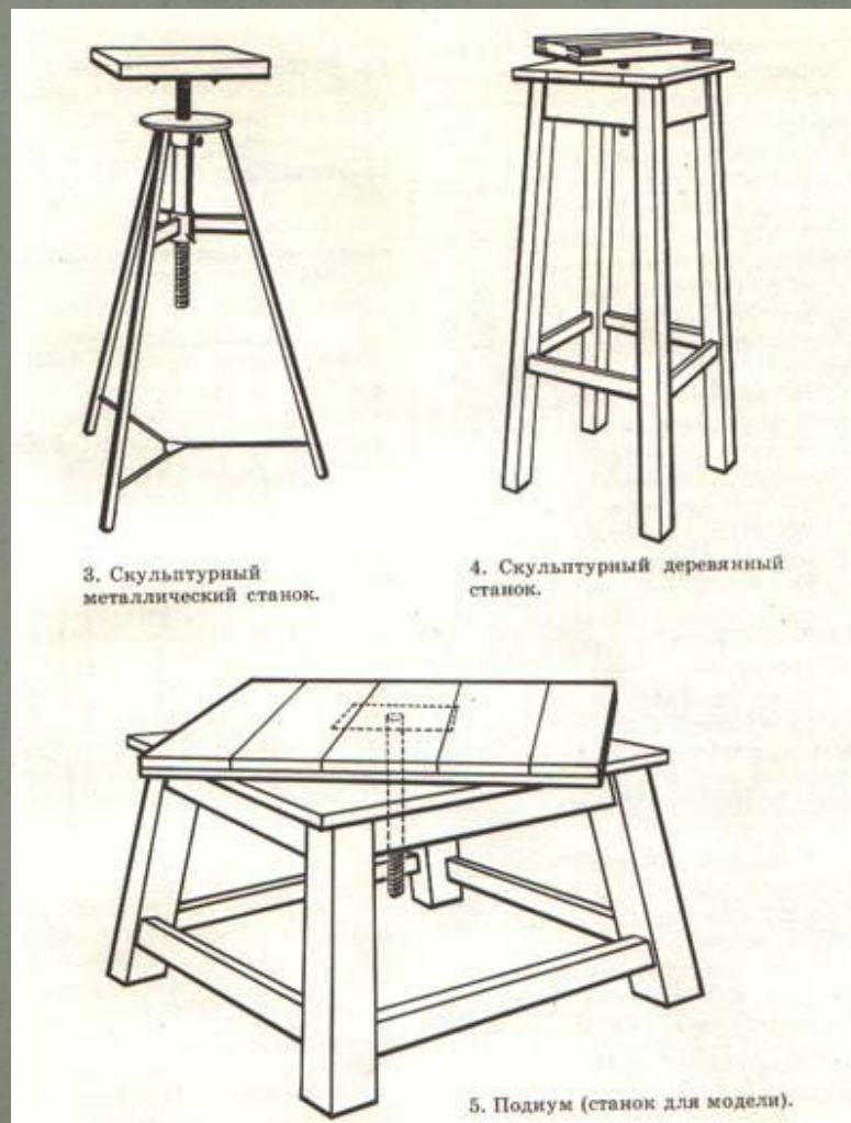
3. Скульптурный металлический станок.