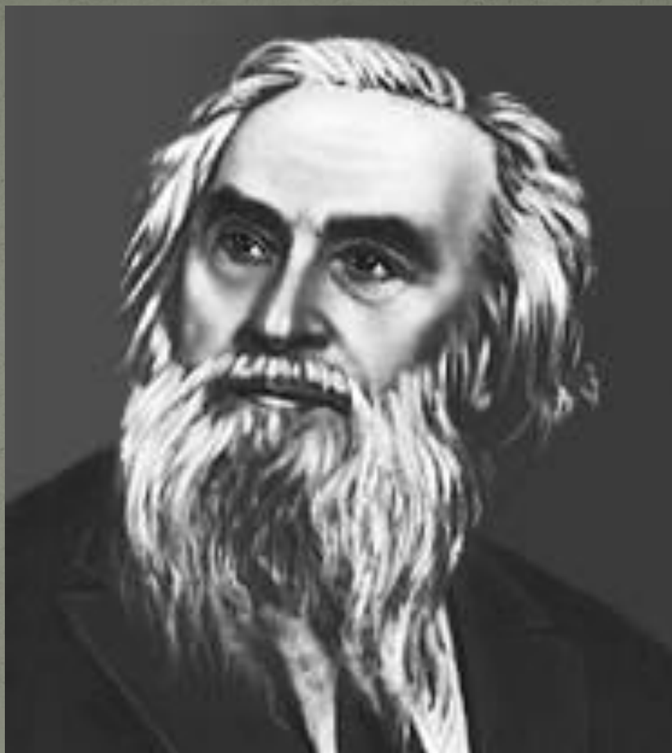
Коненков Сергей Тимофеевич (1874 – 1971)