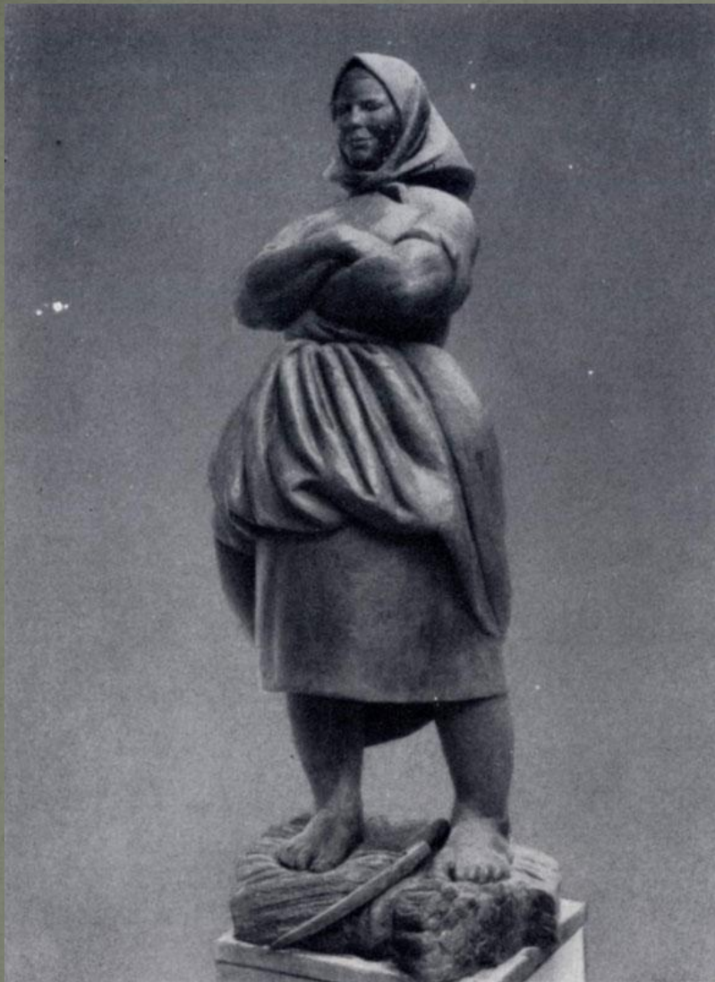
В. И. Мухина. Крестьянка. Бронза.