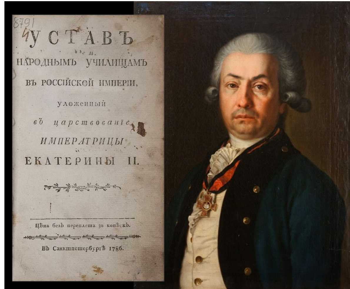
Ф. И. Янкович де Мериево, организатор системы образования в России

Созданная по указу Екатерины II в 1782 году «Комиссия по учреждению народных училищ» разработала к 1786 году «Устав народным училищам Российской Империи». Вводилась классно-урочная система обучения. Основой образовательного процесса полагалось воспитание в учениках добросовестности, трудолюбия и прилежания. При этом категорически запрещалось причинение физического ущерба. В качестве наказаний предпочтительнее было использовать лишение приятных вещей – прогулок, участия в совместных играх и т.д. Согласно уставу, учреждались два типа училищ – малые и главные, кроме них существовали приходские училища.