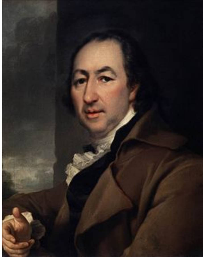
Н. И. НОВИКОВ

Кроме того, императрица не допускала посягательств на собственное понимание идей просвещения. Видный деятель, публицист и издатель большей части книг (в том числе учебников) того времени — Н. И. Новиков был заточён в Шлиссельбургскую крепость по личному указу Екатерины II.