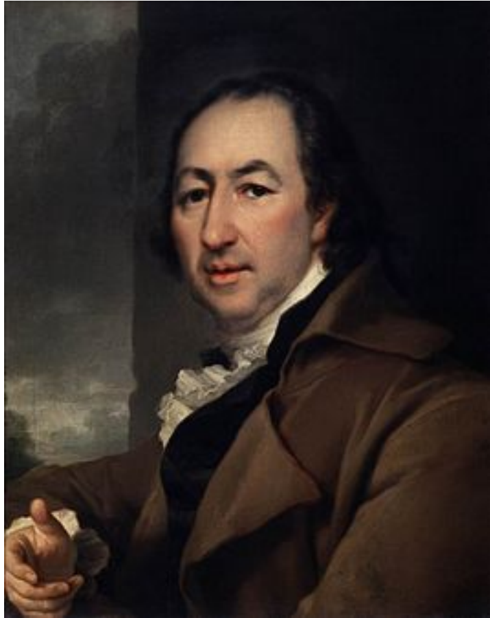
Н. И. НОВИКОВ

Кроме того, императрица не допускала посягательств на собственное понимание идей просвещения. Видный деятель, публицист и издатель большей части книг (в том числе учебников) того времени — Н. И. Новиков был заточён в Шлиссельбургскую крепость по личному указу Екатерины II.