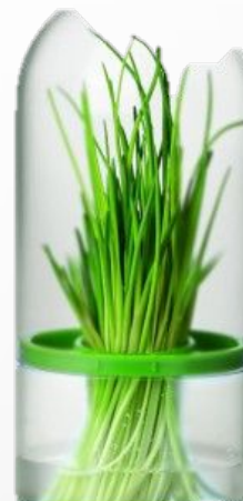
Емкость для хранения трав