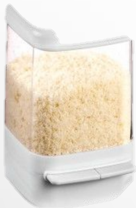
Контейнер для хранения пармезана