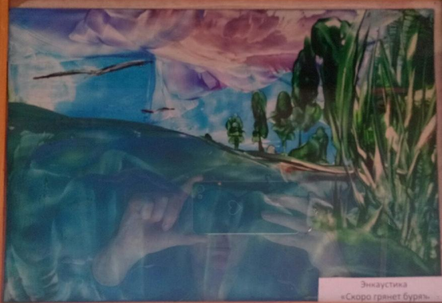
Энкаустика «Скоро грянет буря»