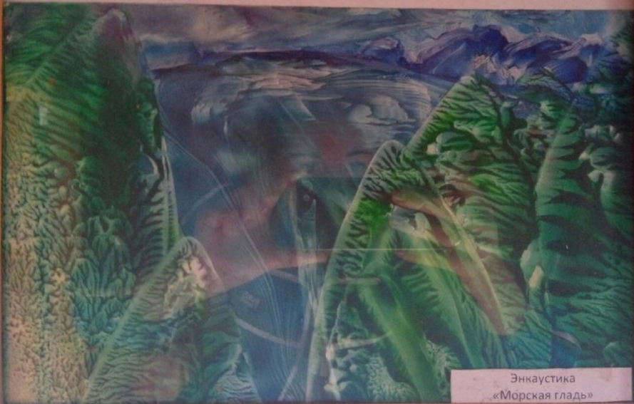
Энкаустика «Морская гладь»