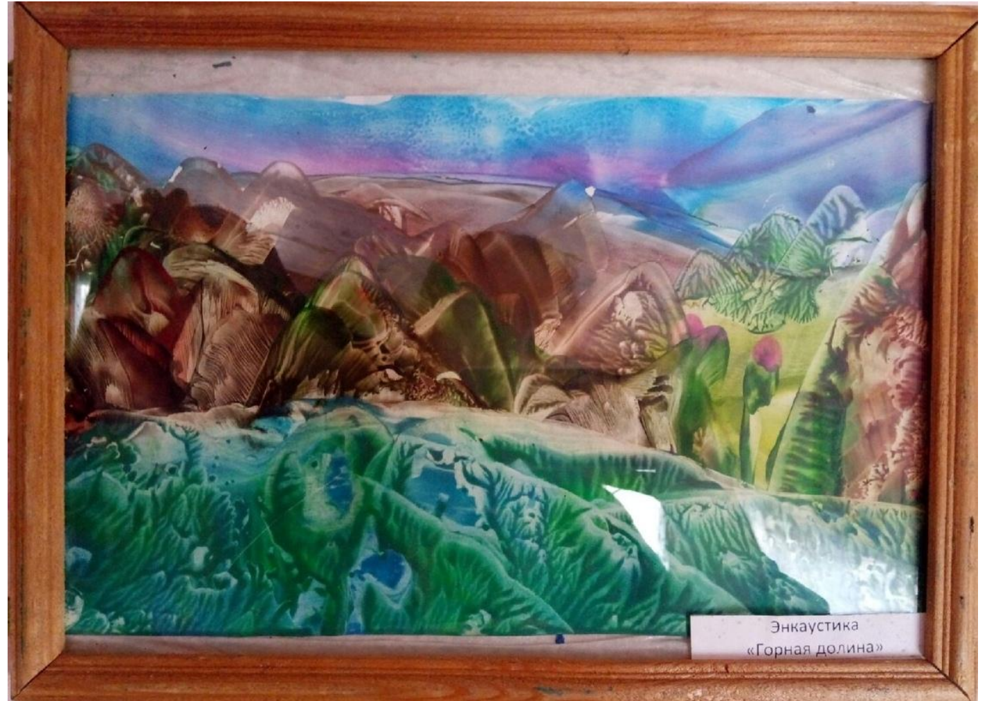
Энкаустика «Горная долина»