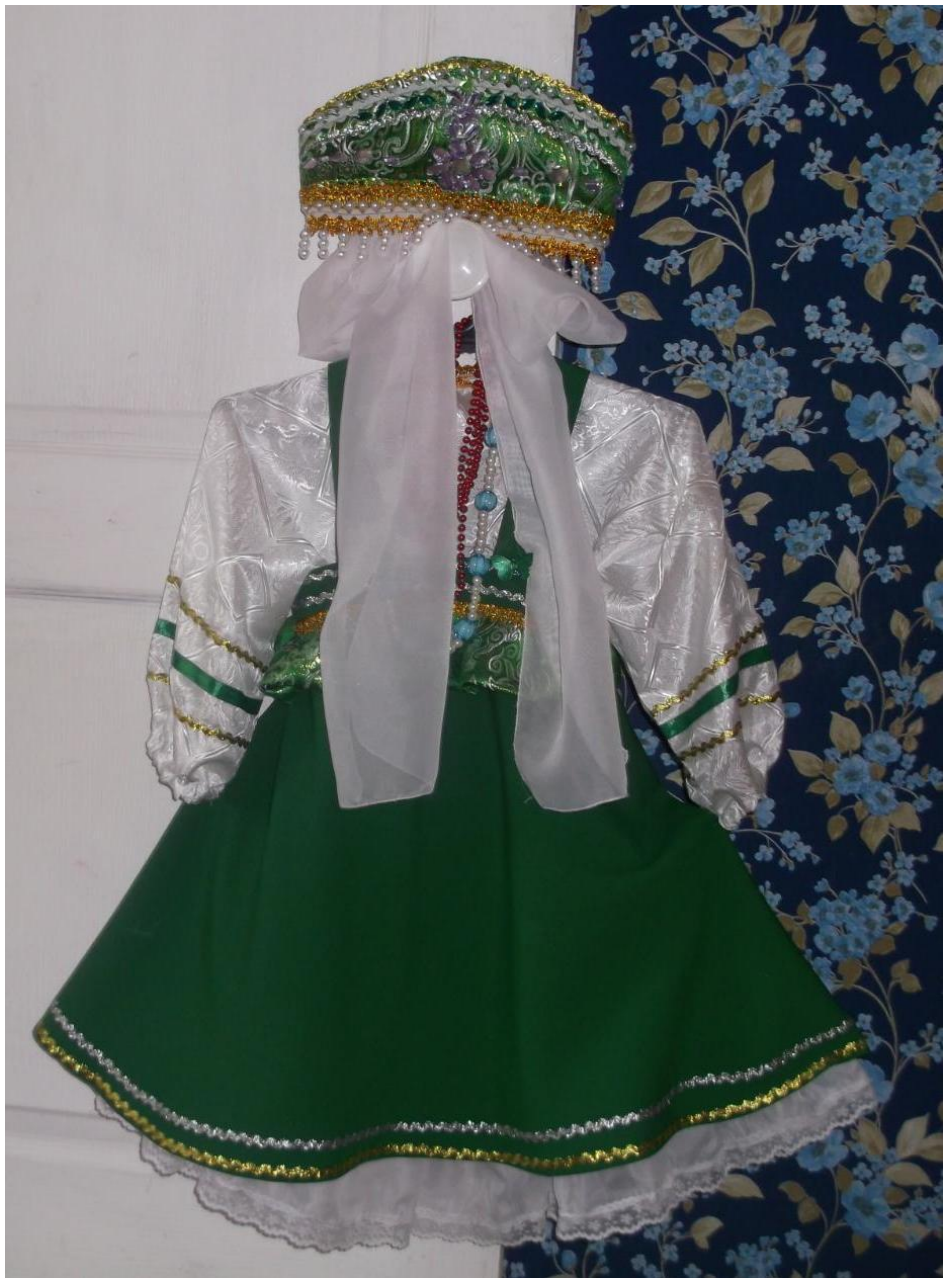
Шила русский концертный костюм для внученьки.

Фантазии полёт и рук творенье С восторгом я держу в своих руках... Не знает, к счастью, красота старенья, Любовь к прекрасному живёт в веках. Умелец может сделать из железки, Из камня, дерева — шедевры красоты. Из разноцветья бисера и лески, Как в сказке, чудеса творишь и ты. Я прикасаюсь к броши осторожно, Она чарует и ласкает взор. Представить трудно, как это возможно Создать невиданной красы узор. Как результат терпенья и умения — Изящество, и цвета чистота, И совершенство формы... Нет сомненья, Наш мир спасут талант и красота!