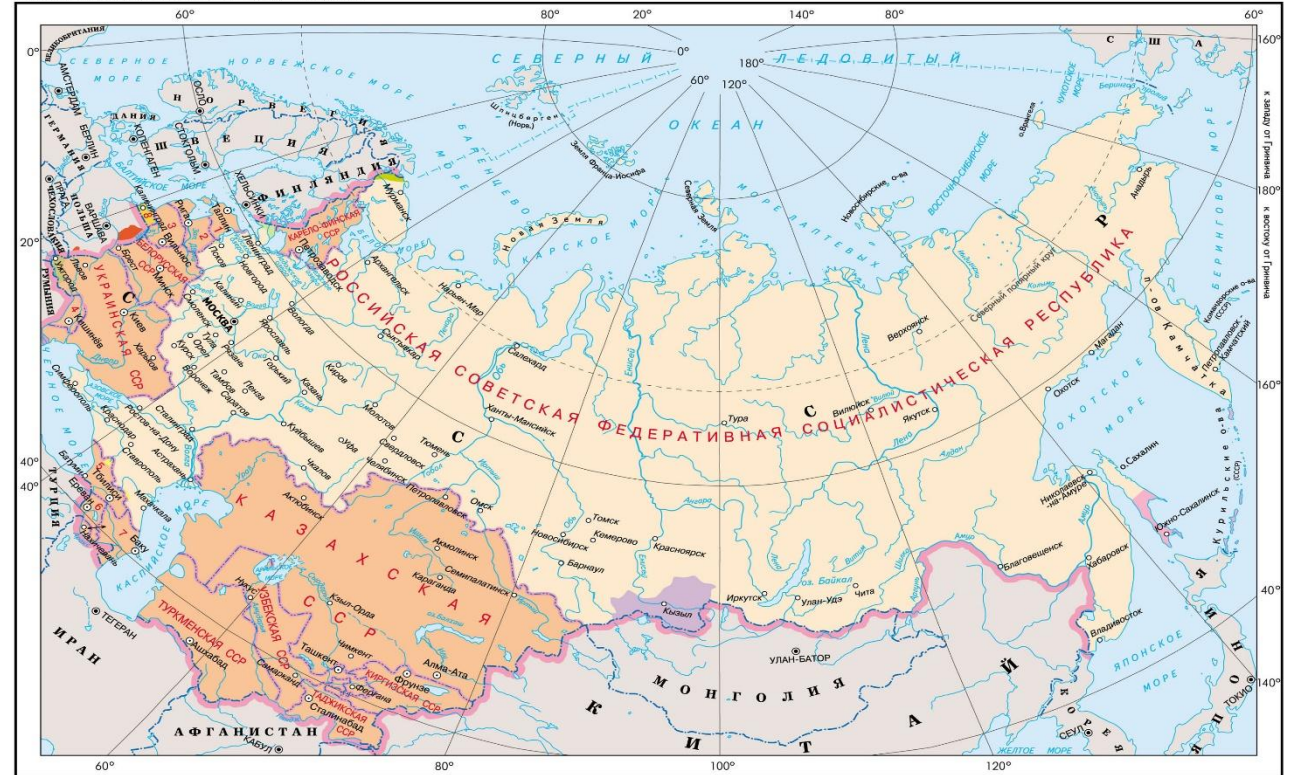
Россия в составе СССР в 1940–1946 гг.