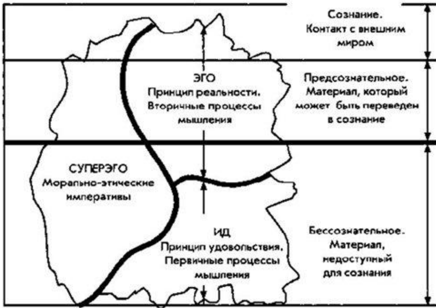
Рис. 1. Структурная модель личности по З. Фрейду.