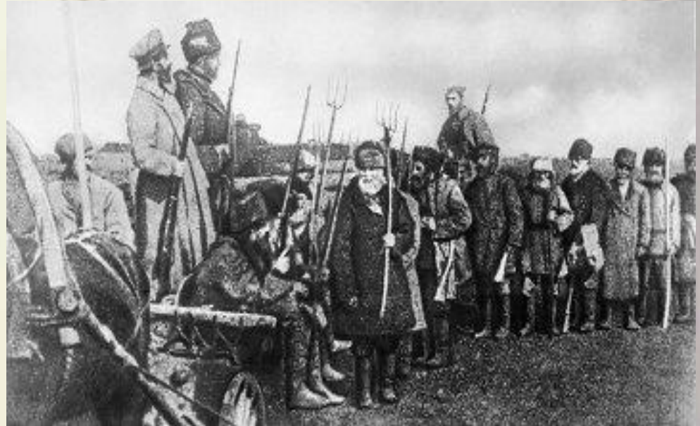
Тамбовские крестьяне против советской власти