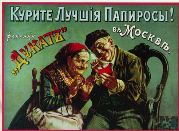
Реклама 20-х годов.

Изменения коснулись и социального состава деревни большая часть крестьян стала середняками, а кулаки составляли 3,5%.