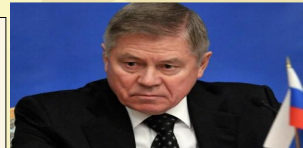
Лебедев В.М. Председатель Верховного суда РФ

Судебная власть – вид государственной власти, связанный с осуществлением правосудия посредством конституционного, гражданского, административного и уголовного судопроизводства