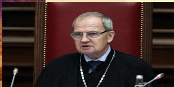
Зорькин В.Д. Председатель Конституционного суда РФ

Судебная власть – вид государственной власти, связанный с осуществлением правосудия посредством конституционного, гражданского, административного и уголовного судопроизводства