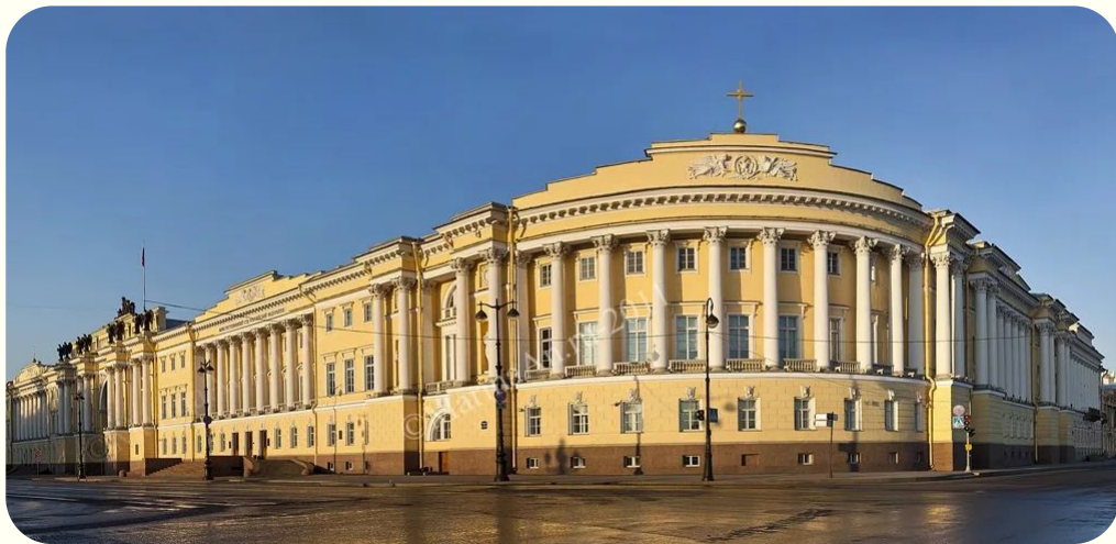
Конституционный суд РФ Г. Санкт-Петербург

К судам субъектов Российской Федерации относятся: конституционные (уставные) суды и мировые суды субъектов Федерации.