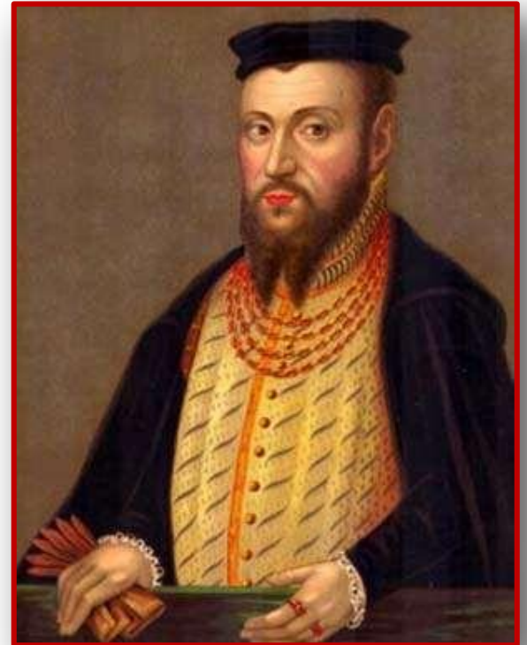
Сигизмунд II Август

Условия объединения Польши и ВКЛ были выработаны на Люблинском сейме, который состоялся в 1569 г. и длился 6 месяцев. Польша стремилась к инкорпорации (включение, присоединение) ВКЛ в состав Польши (Короны), опираясь на католических феодалов и католическую церковь. Делегация ВКЛ во главе с канцлером ВКЛ Николаем Радзивиллом Рыжим выступала за заключение равноправного союза с Польшей. Польской стороне на сейме