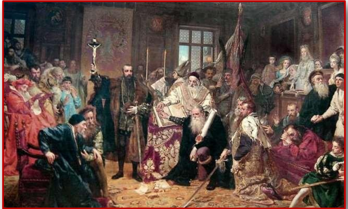
Люблинская уния. Худ. Я. Матейко

Итоги Люблинской унии обусловили политическое положение ВКЛ в составе Речи Посполитой. Ряд богатейших земель были включены в состав Польши, из-за чего территория ВКЛ существенно уменьшилась. Итоги Люблинской унии вызвали недовольство большей части магнатов ВКЛ, которым нужно было делить политическую власть с поляками. К тому же согласно унии польская шляхта имела право получать земельные владения в