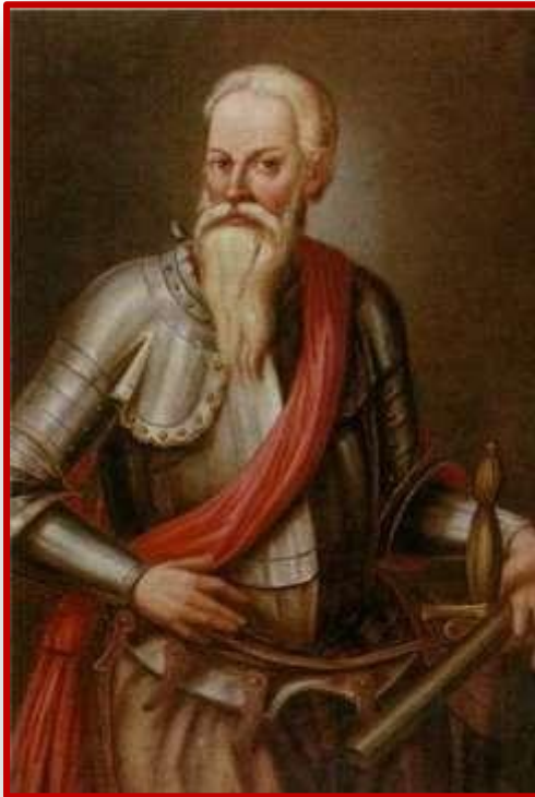
Николай Радзивилл Радзивилл Рыжий