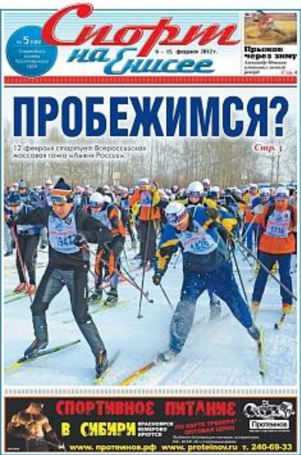
Выпуск за февраль 2012г