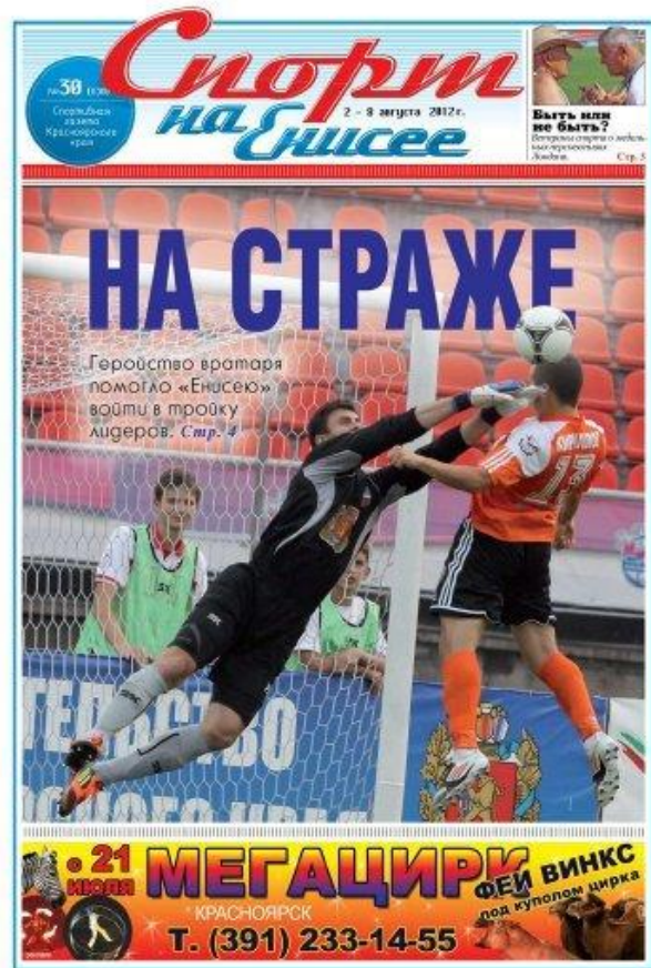
Выпуск за август 2012г