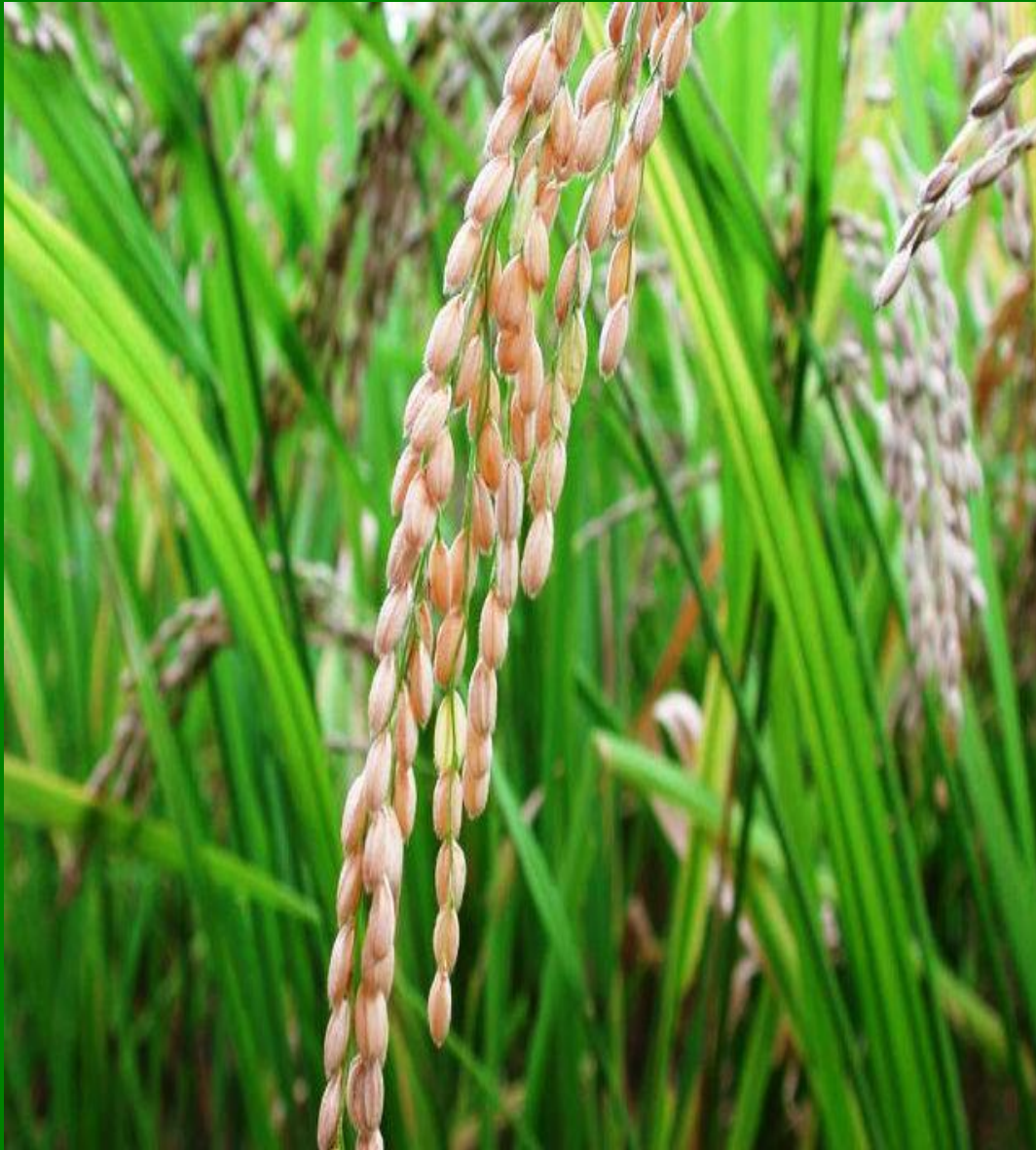
Рис требователен к теплу и влаге, поэтому основными районами рисосеяния являются Северный Кавказ (Краснодарский край), Поволжье (междуречье Волги и Ахтубы) и Приморский край.