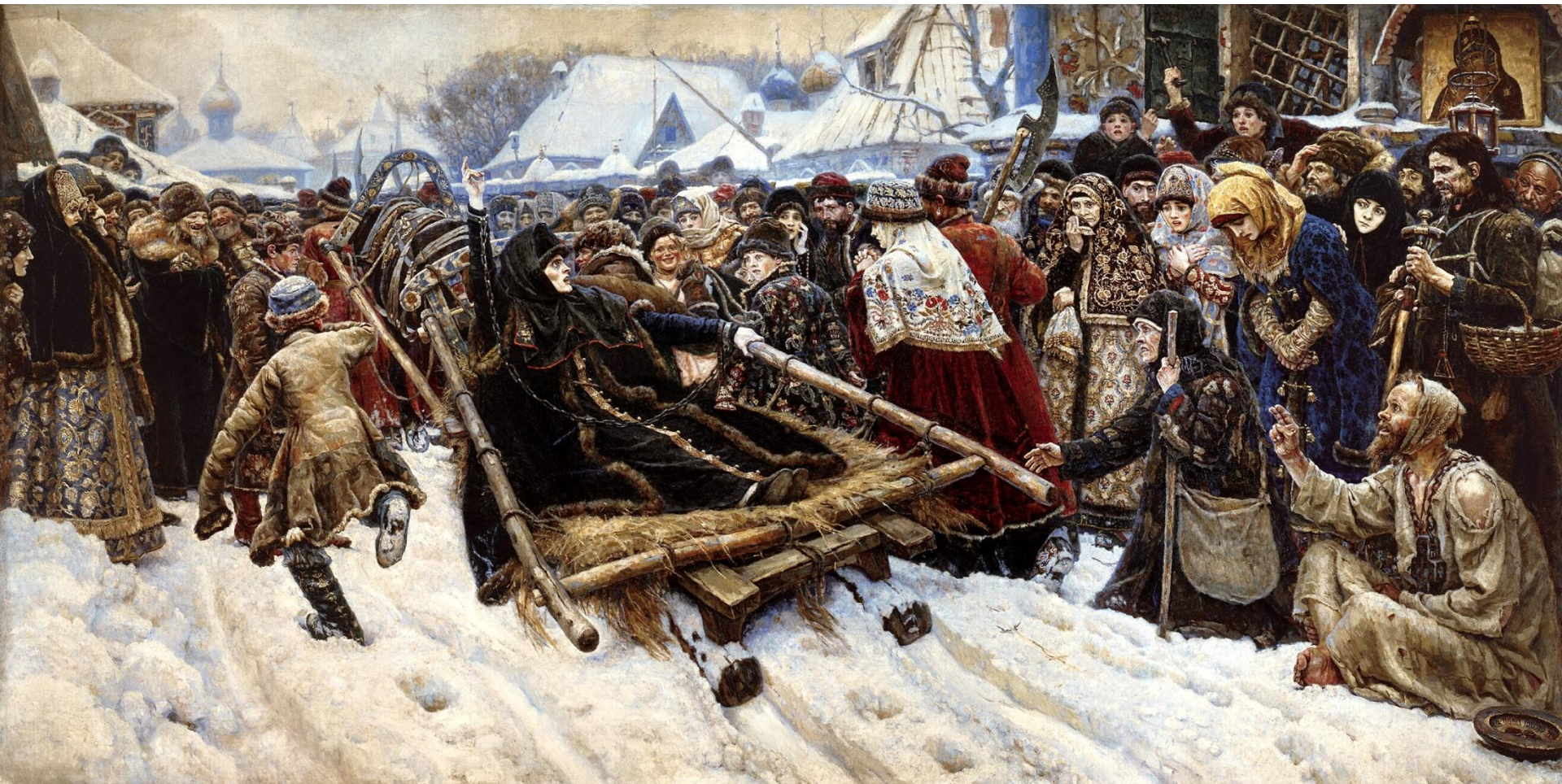
▣ Суриков В. «Боярыня Морозова»