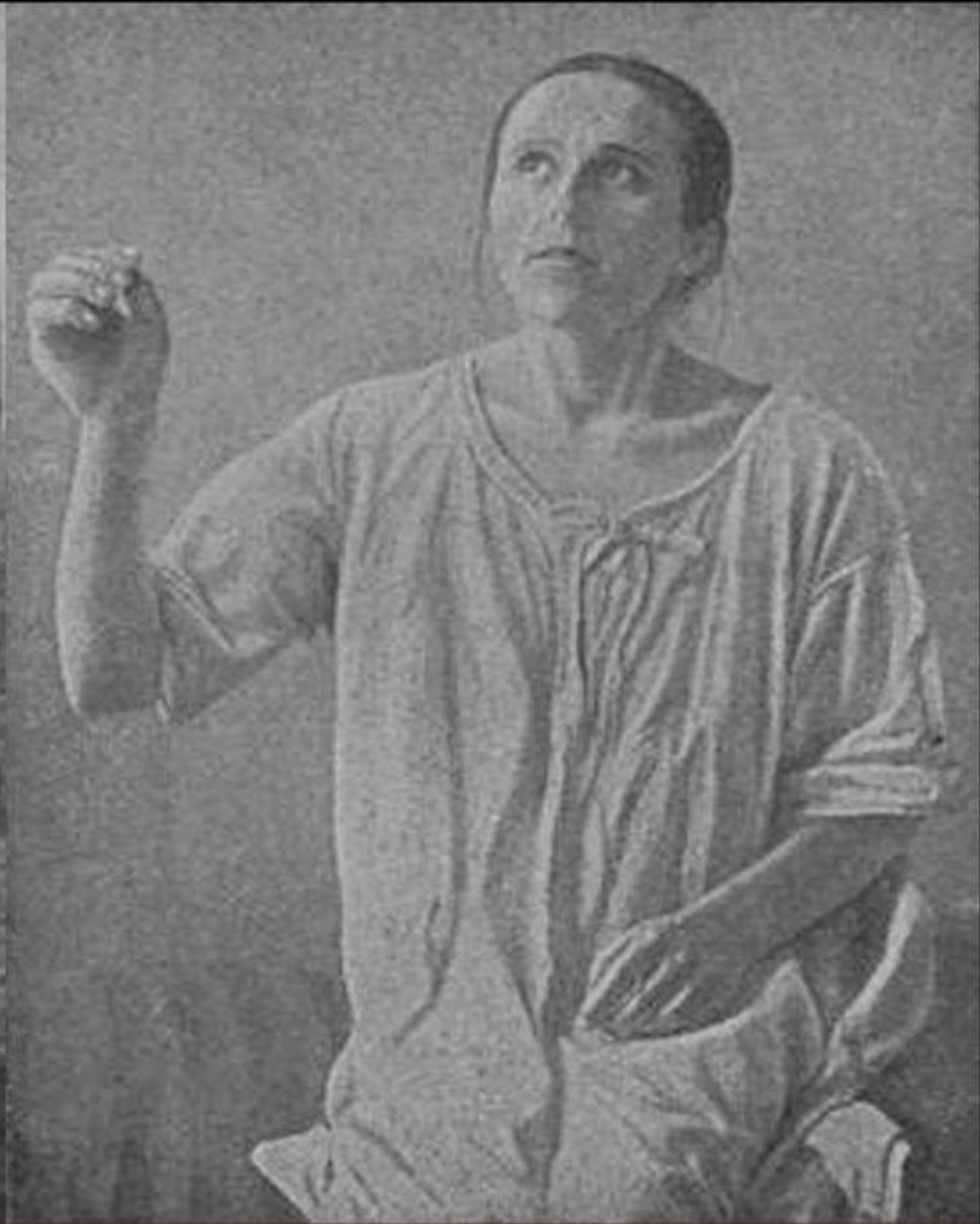
Параноидная шизофрения (вычурная поза, галлюцинаторно-параноидный синдром)