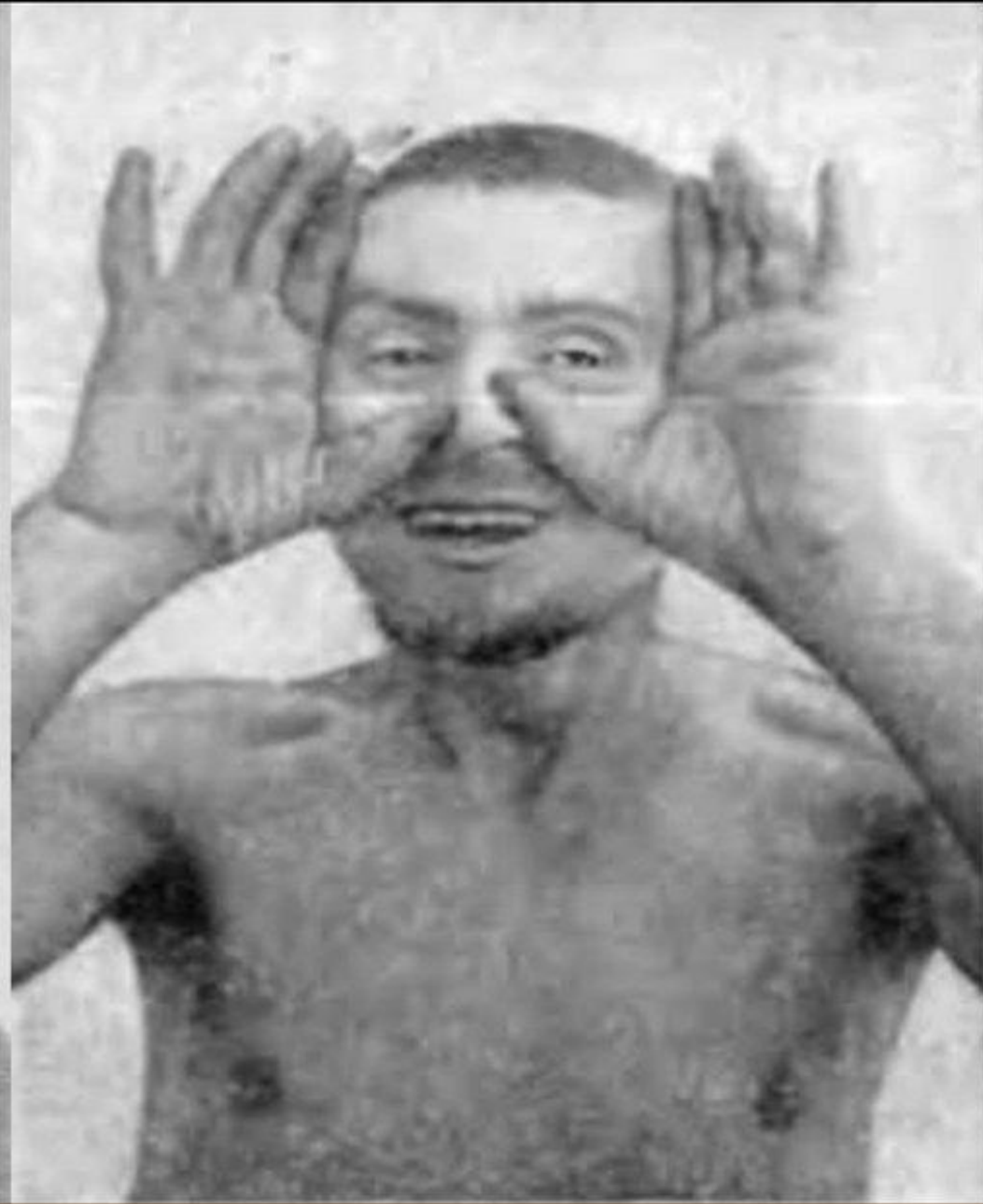
Гебефреническая шизофрения (гебефреническое возбуждение)