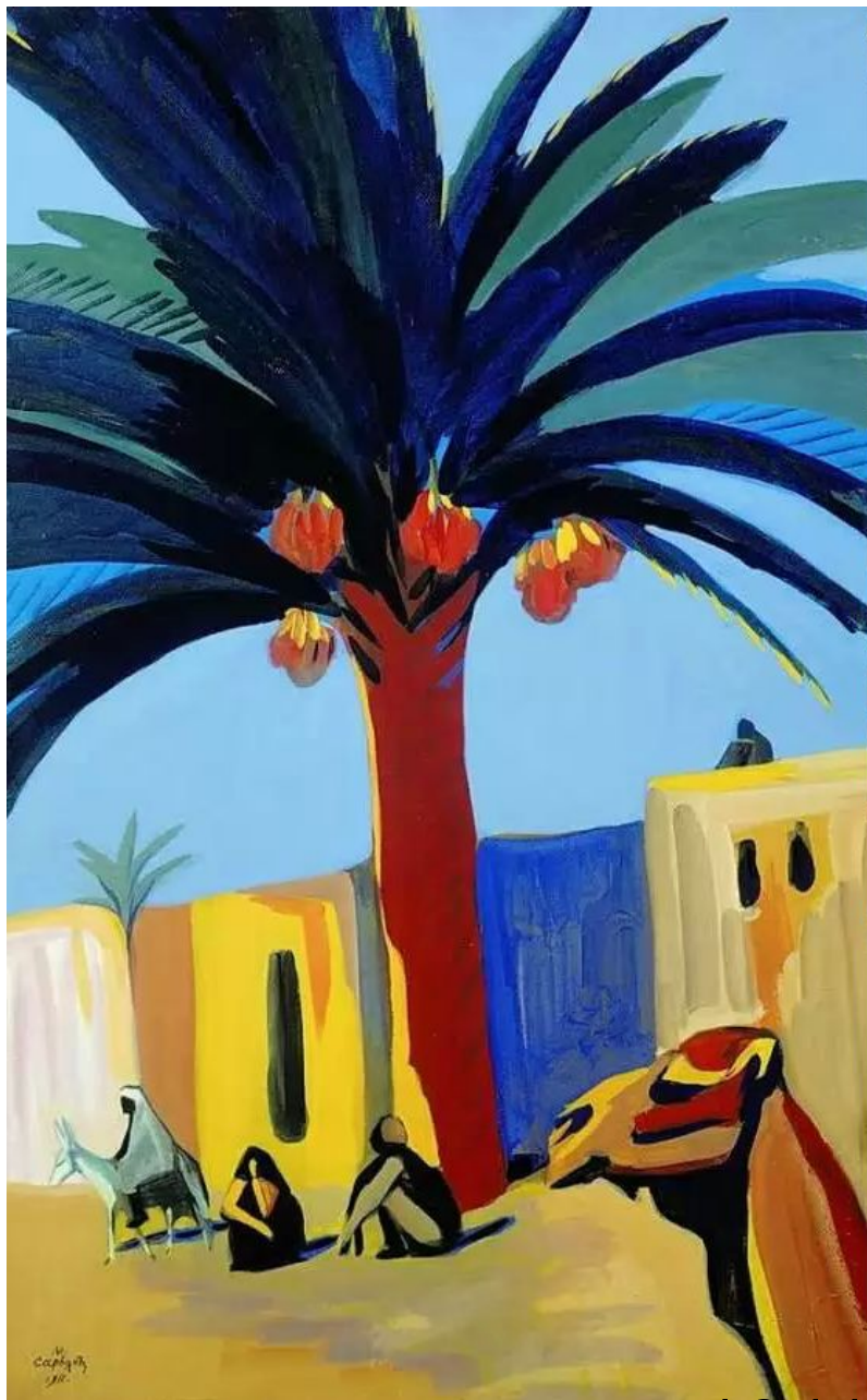
Финиковая пальма. 1911 г.