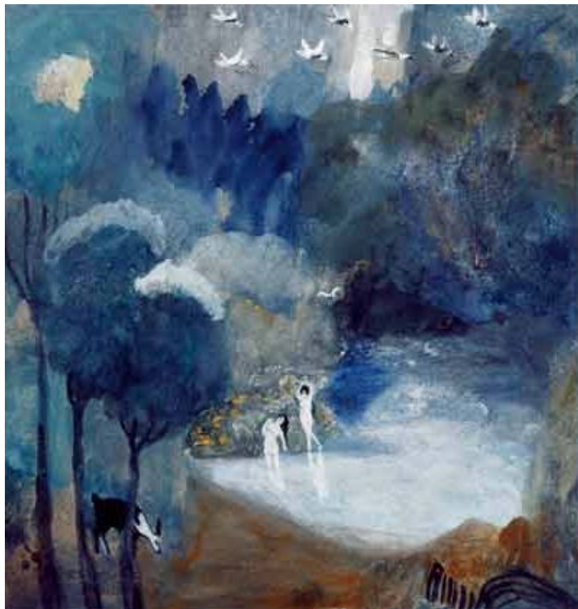
М.С.Сарьян. Озеро фей

Картины, представленные на выставке 1907 г.