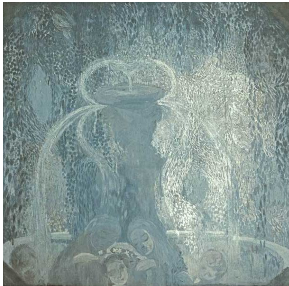
П.В. Кузнецов Голубой фонтан. 1905 г. Холст, темпера, 127 x 131.

(Из цикла «Сказки и сны») 1905. Бумага, гуашь.