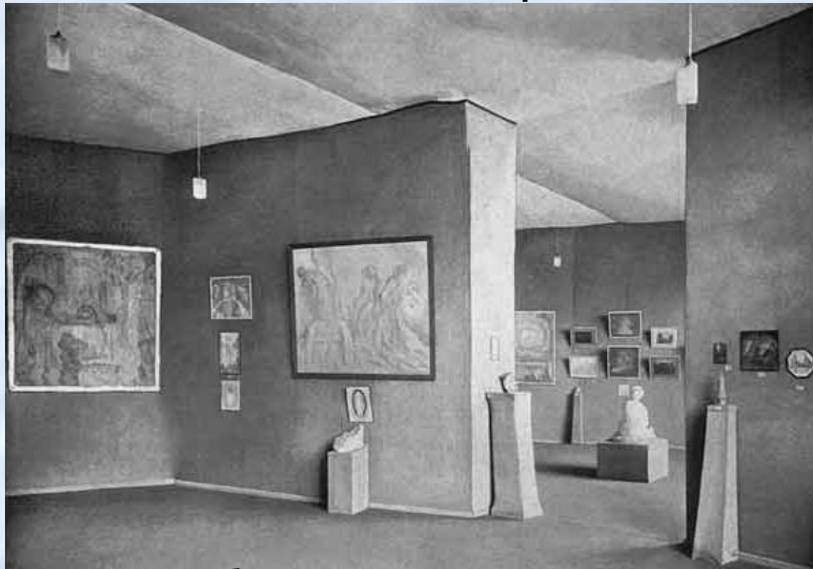
Интерьер выставки «Голубая Роза». Москва. Дом М.С.Кузнецова. 1907

Фантастическое название говорит о тематике работ.