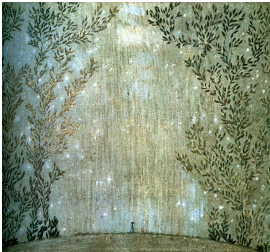
Пётр Саввич Уткин. Торжество в небе. 1905 г.