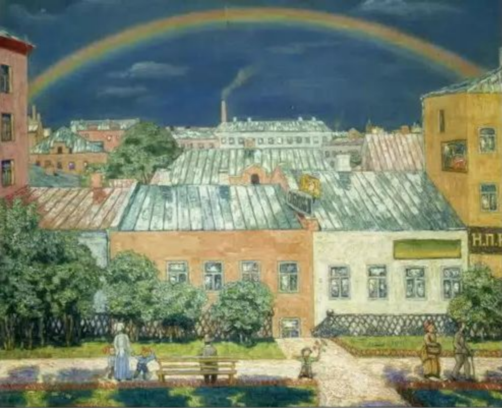
Московский пейзаж. Радуга. 1908 г.

«Я умею писать только кусты и заборы, но это я делаю лучше всех». Крымов Н.П.