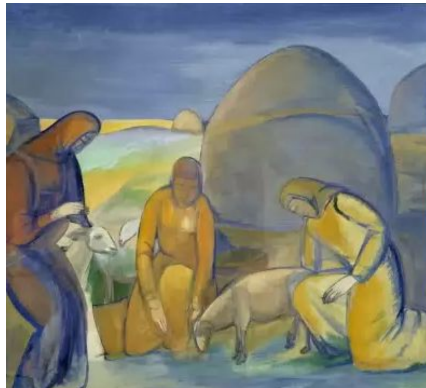
В степи за работой. Стрижка овец. 1913 г.

Обобщённость форм, сочетание серо-голубой гаммы с яркими цветовыми