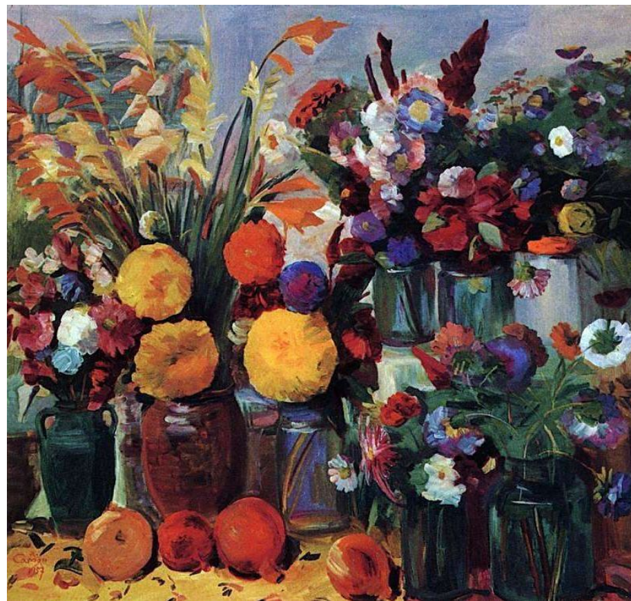
Ереванские цветы. 1957 г.