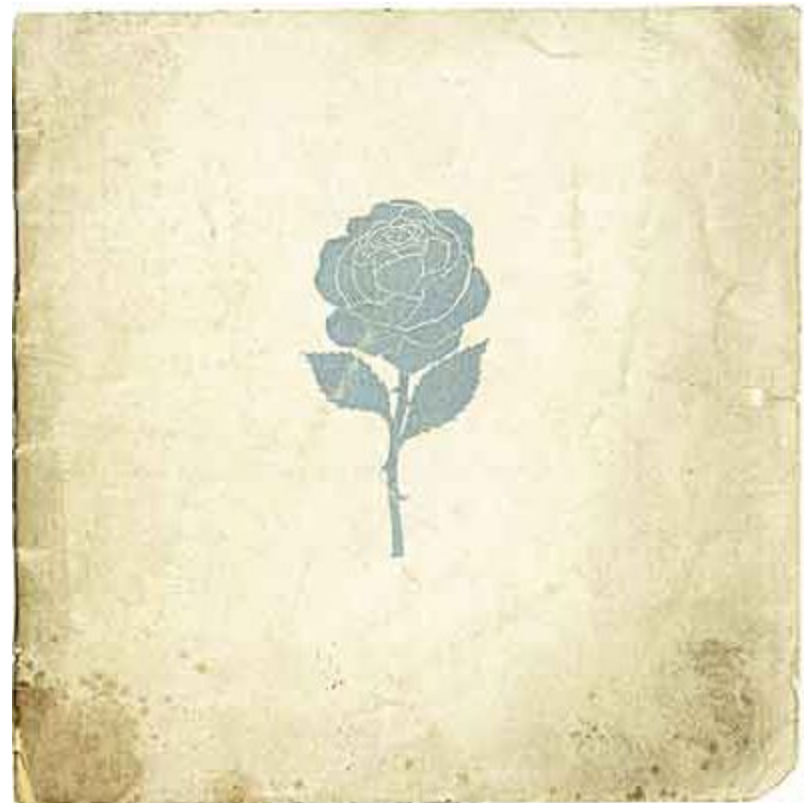
Н.Н. Сапунов. Обложка каталога выставки «Голубая роза»