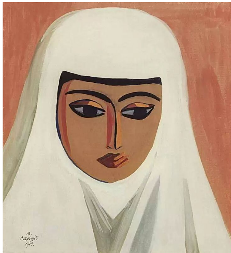
Персиянка. 1910 г.