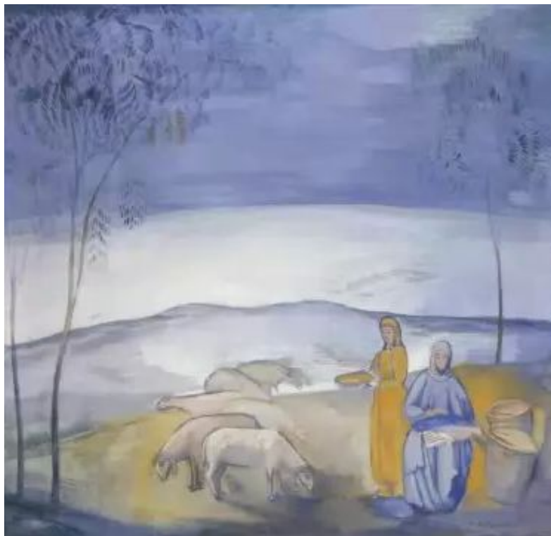
Вечер в степи. 1912 г.

Картины «Киргизской сюиты» показывают мир, наполненный просветлённым покоем и созерцанием, в котором человек живёт в гармонии с космосом.