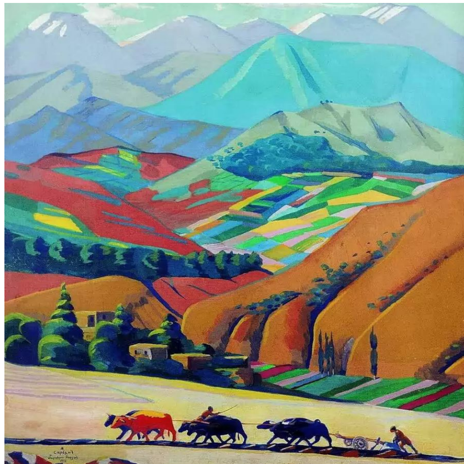
Горы. 1923 г.