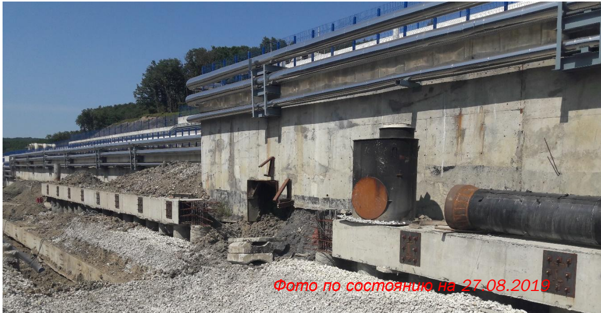
Фото по состоянию на 27.08.2019

ПК "Шесхарис". ПП "Грушовая». Строительство резервуаров РВС (П)-30000 м3. Резервуар № 9, 10, 11, 12, 13, 14"