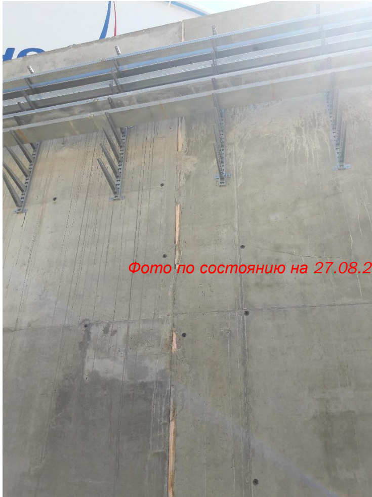
Фото по состоянию на 27.08.2019

ПК "Шесхарис". ПП "Грушовая». Строительство резервуаров РВС (П)-30000 м3. Резервуар № 9, 10, 11, 12, 13, 14"