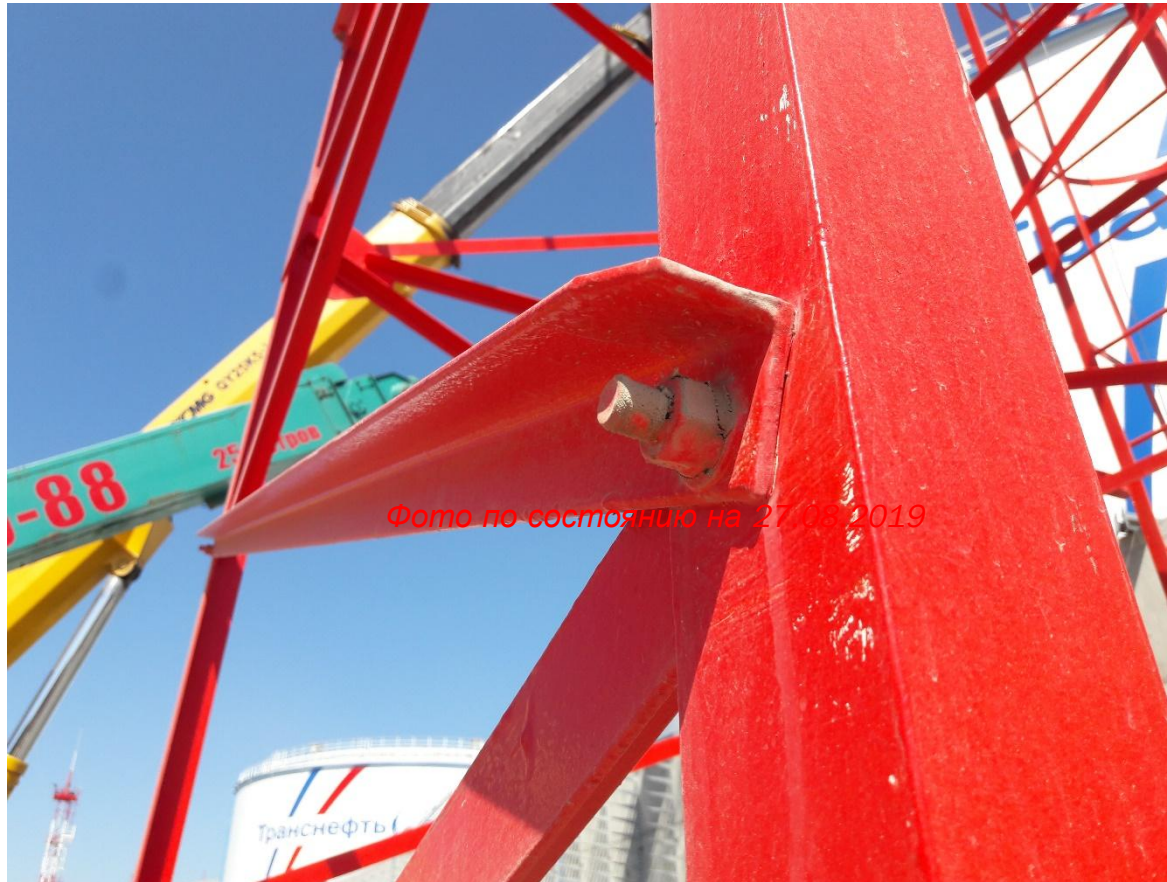
Фото по-прежнему на 27.06.2019

ПК "Шесхарис". ПП "Грушовая». Строительство резервуаров РВС (П)-30000 м3. Резервуар № 9, 10, 11, 12, 13, 14"