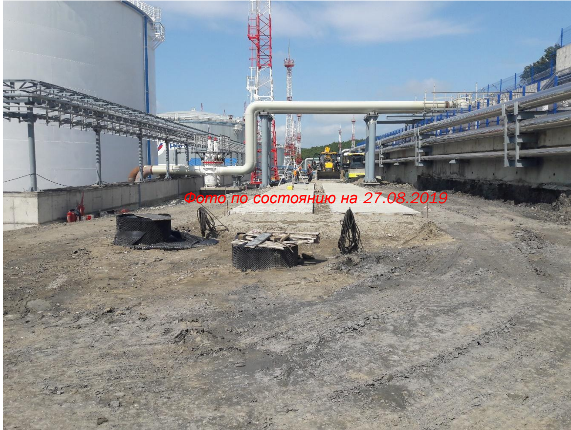
Фото по состоянию на 27.08.2019

ПК "Шесхарис". ПП "Грушовая». Строительство резервуаров РВС (П)-30000 м3. Резервуар № 9, 10, 11, 12, 13, 14"