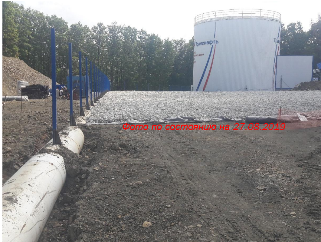
Фото по состоянию на 27.08.2019

ПК "Шесхарис". ПП "Грушовая». Строительство резервуаров РВС (П)-30000 м3. Резервуар № 9, 10, 11, 12, 13, 14"