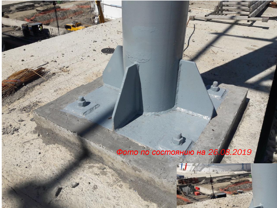
Фото по состоянию на 26.08.2019

ПК "Шесхарис". ПП "Грушовая». Строительство резервуаров РВС (П)-30000 м 3 . Резервуар № 9, 10, 11, 12, 13, 14"