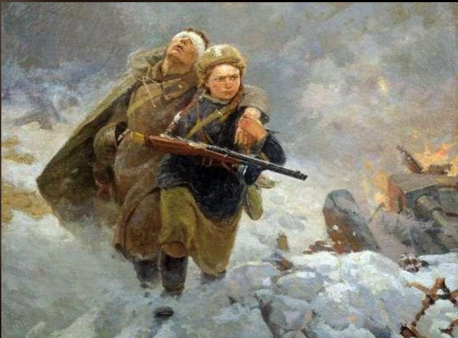
М. Самсонов « Сестрица » 1953 г.

Благодаря подвигу нашего народа, который сражался и погибал, помогал своим однополчанам, победа была за нами.