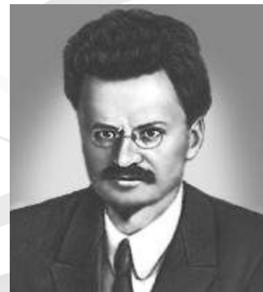
Чапаев Ворошилов Фрунзе Троцкий