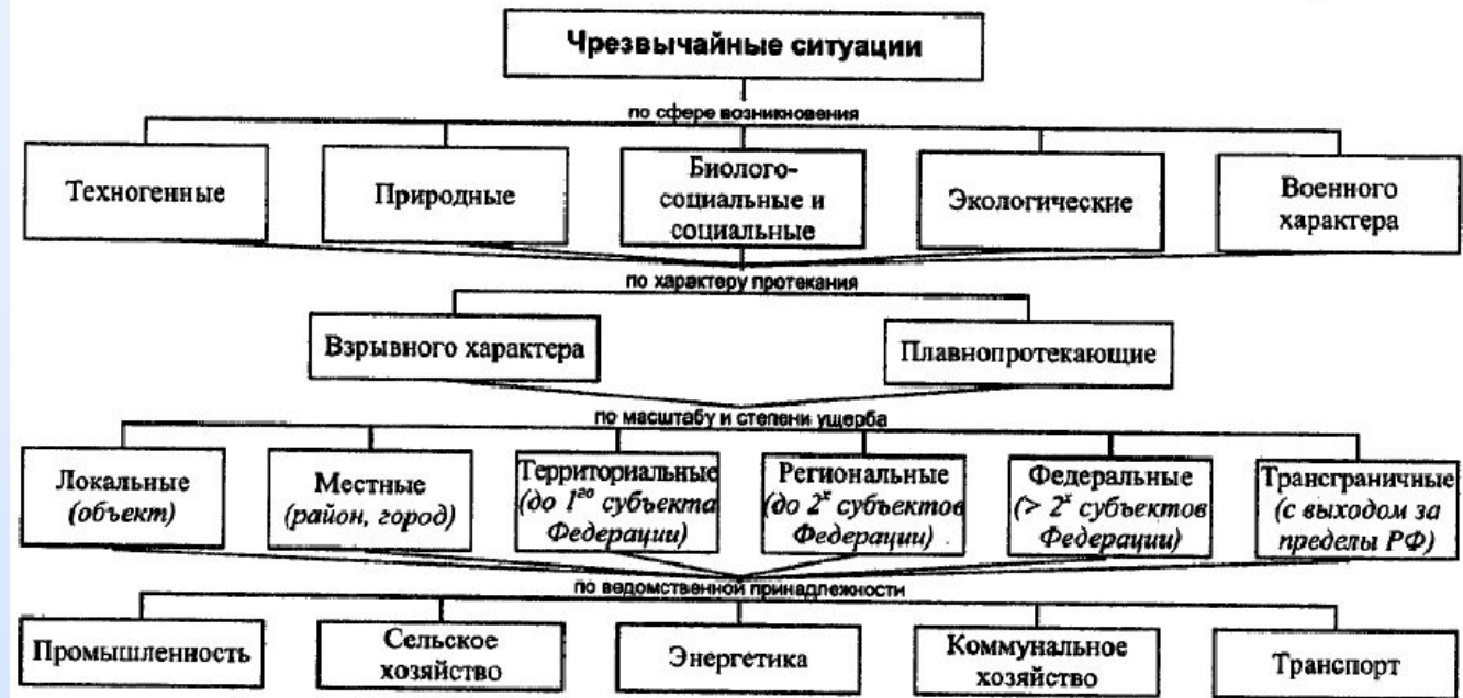
Классификация чрезвычайных ситуаций (общая схема)