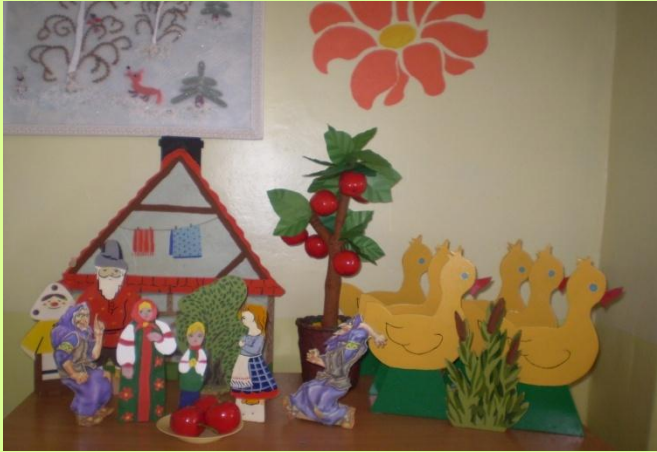
«Настольный театр» Сказка «Гуси лебеди»