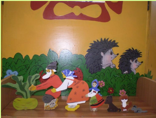
Настольный театр «Репка»