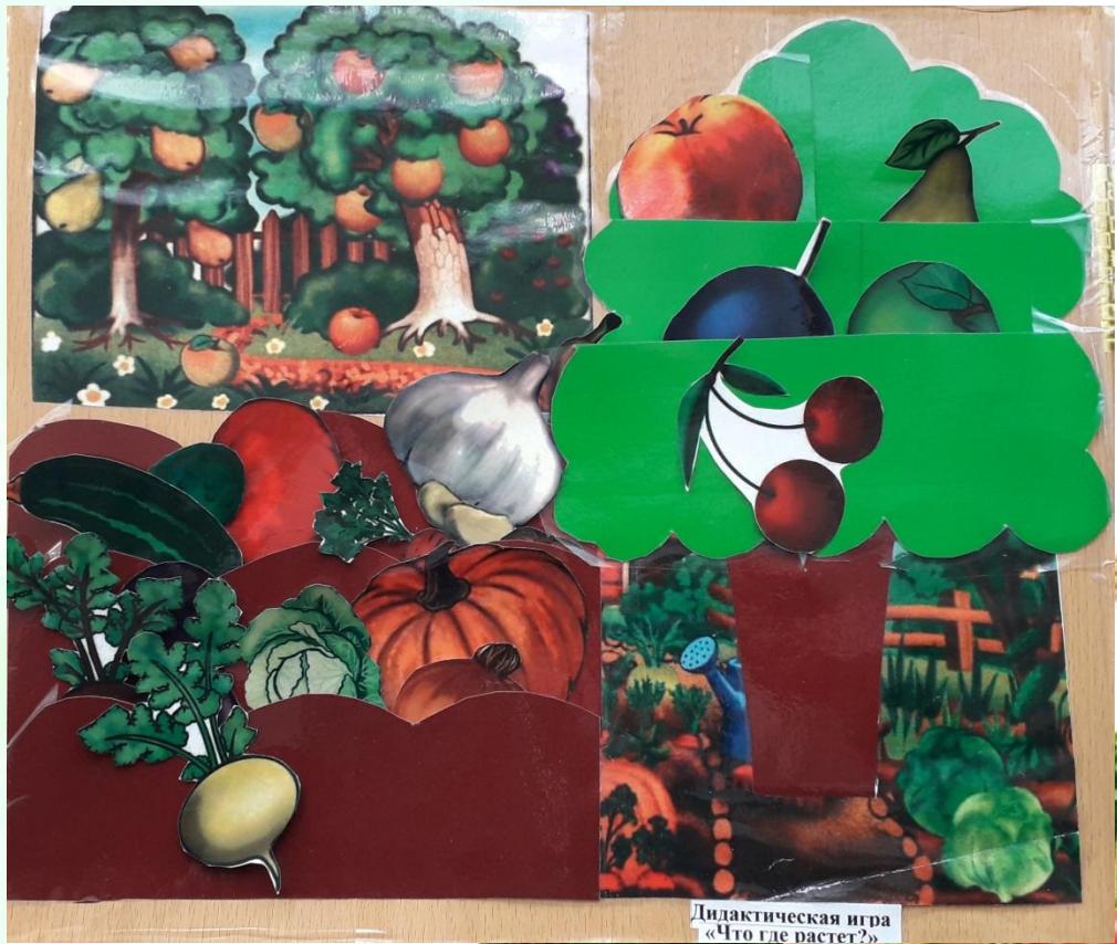
Дидактическая игра «Что где растет?»