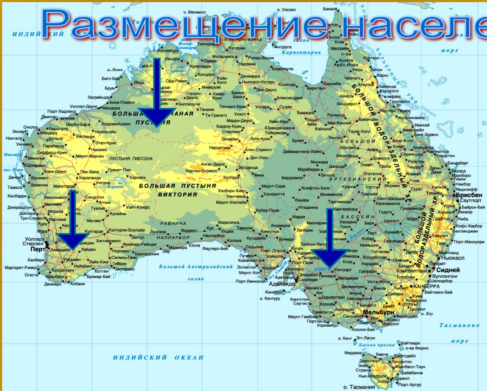
Наиболее плотно и малозаселённые районы Австралии.