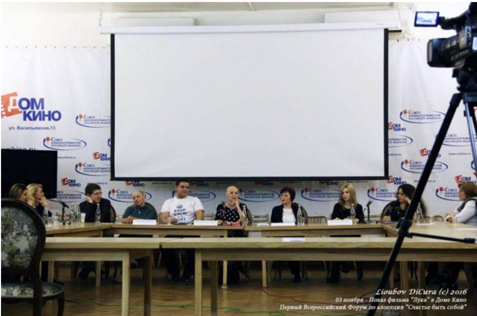
Лиубов DiCura (c) 2016 03 ноября - Показ фильма "Лука" в Доме Кино Первый Всероссийский Форум по алопеции "Счастье быть собой"