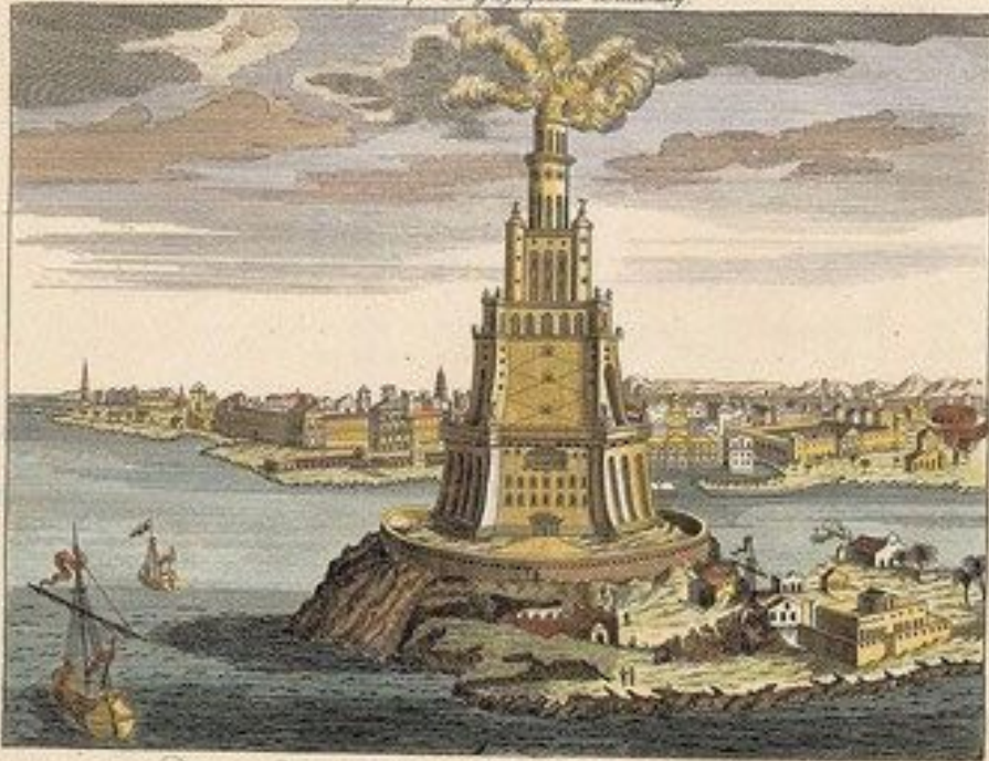
The Pharos of PTOLOMEY King of Egypt -

Copper-plate for the Geographical Dictionary.