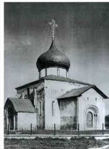
Георгиевский собор в Юрьеве-Польском. 1230-1234

Георгиевский собор — белокаменный собор, расположенный на территории древнего детинца в городе Юрьеве-Польском Владимирской области. Сооружён в 1230—1234 годах князем Святославом Всеволодовичем.