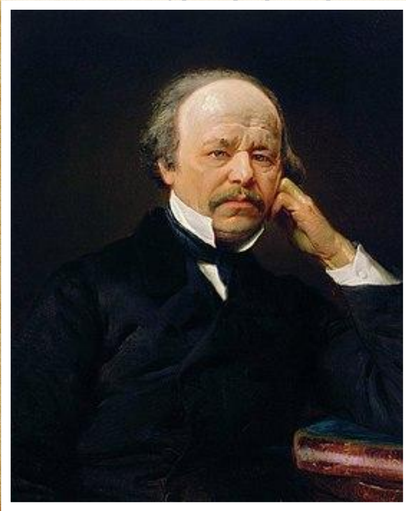
А. С. Даргомыжский

А. С. Даргомыжский современник Пушкина, друг Глинки, также испытал могучее воздействие любовной лирики Пушкина А. С. Он придал романсу сходство с элегией. Элегия выражает не только лирический порыв, но и раздумья о смысле жизни. Неторопливо льётся благородно написанная мелодия на фоне спокойного сопровождения. В этом произведении, как в стихотворении, так и в музыкальном творении, чувство любви вынуждено подчиняться другому чувству самоотречению.