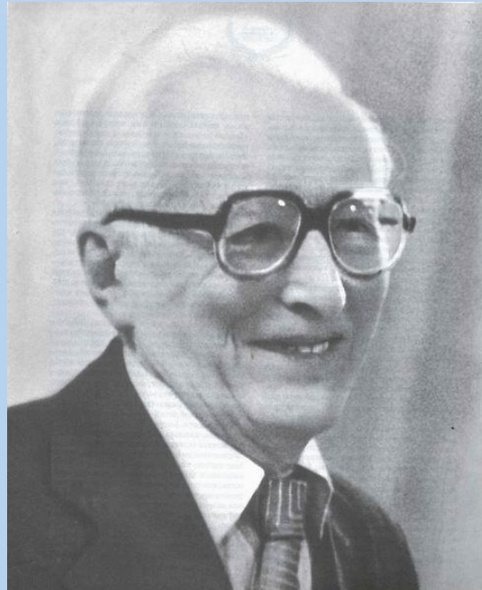
Гальперин, Пётр Яковлевич