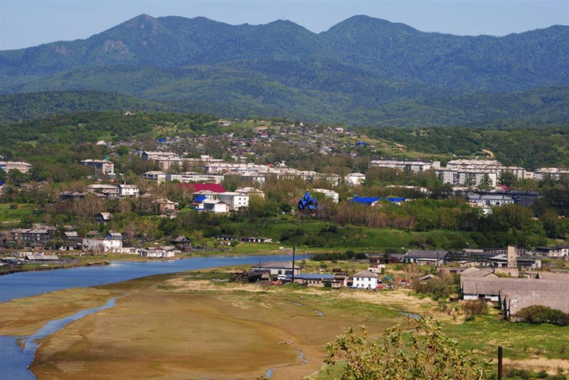
Город Александровск - Сахалинский