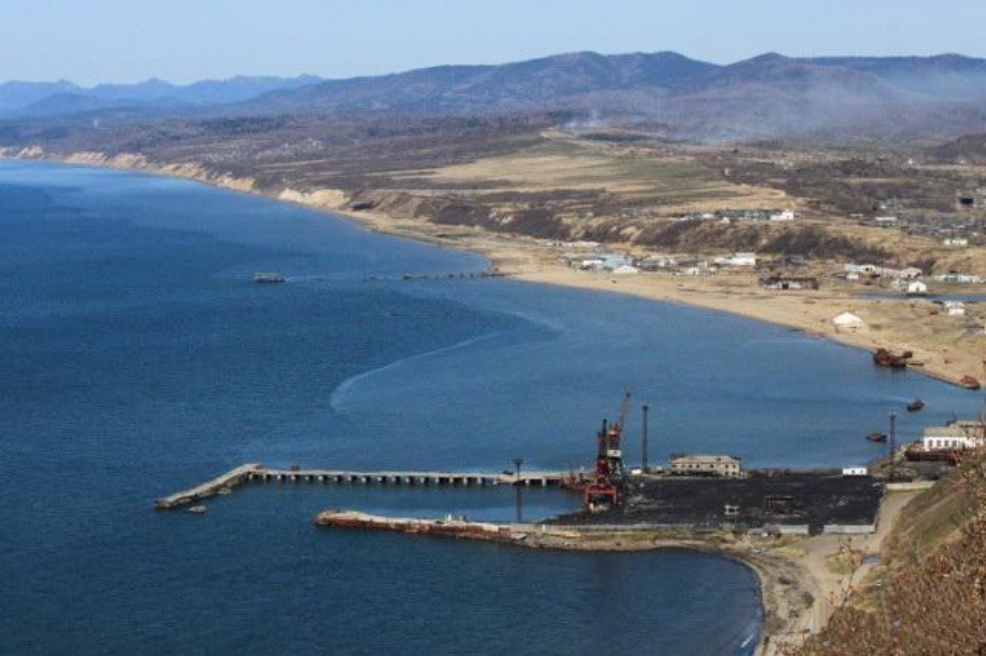
Александровский морской порт