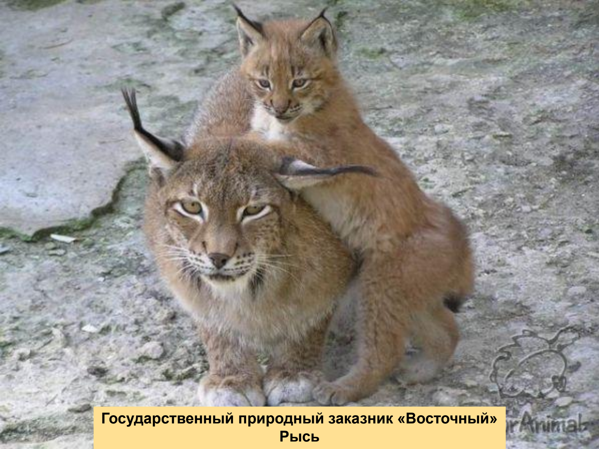
Государственный природный заказник «Восточный» Рысь