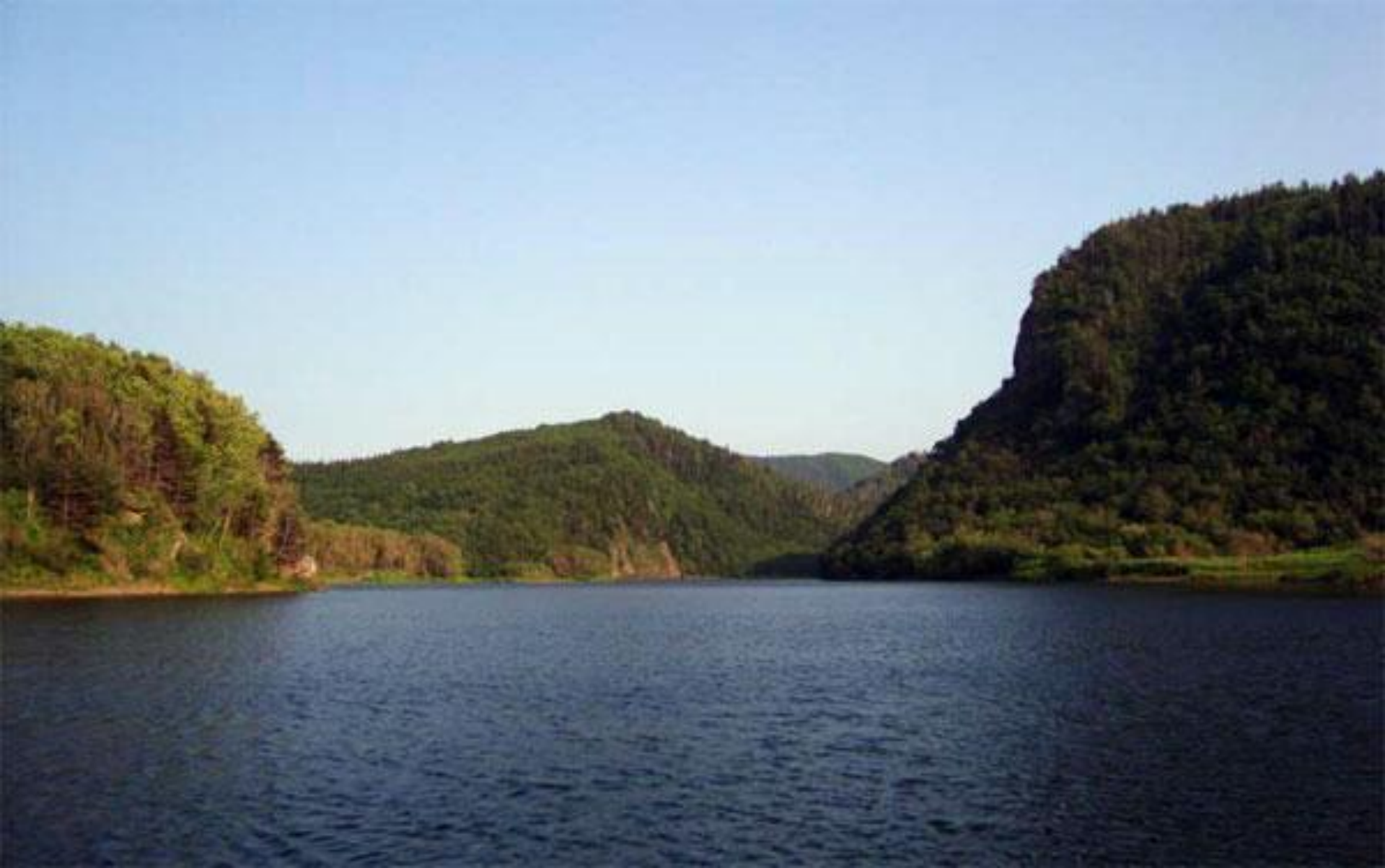
Река Большая Александровка