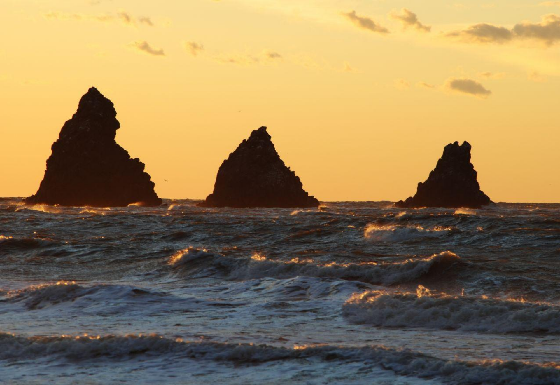
Скалы Три брата