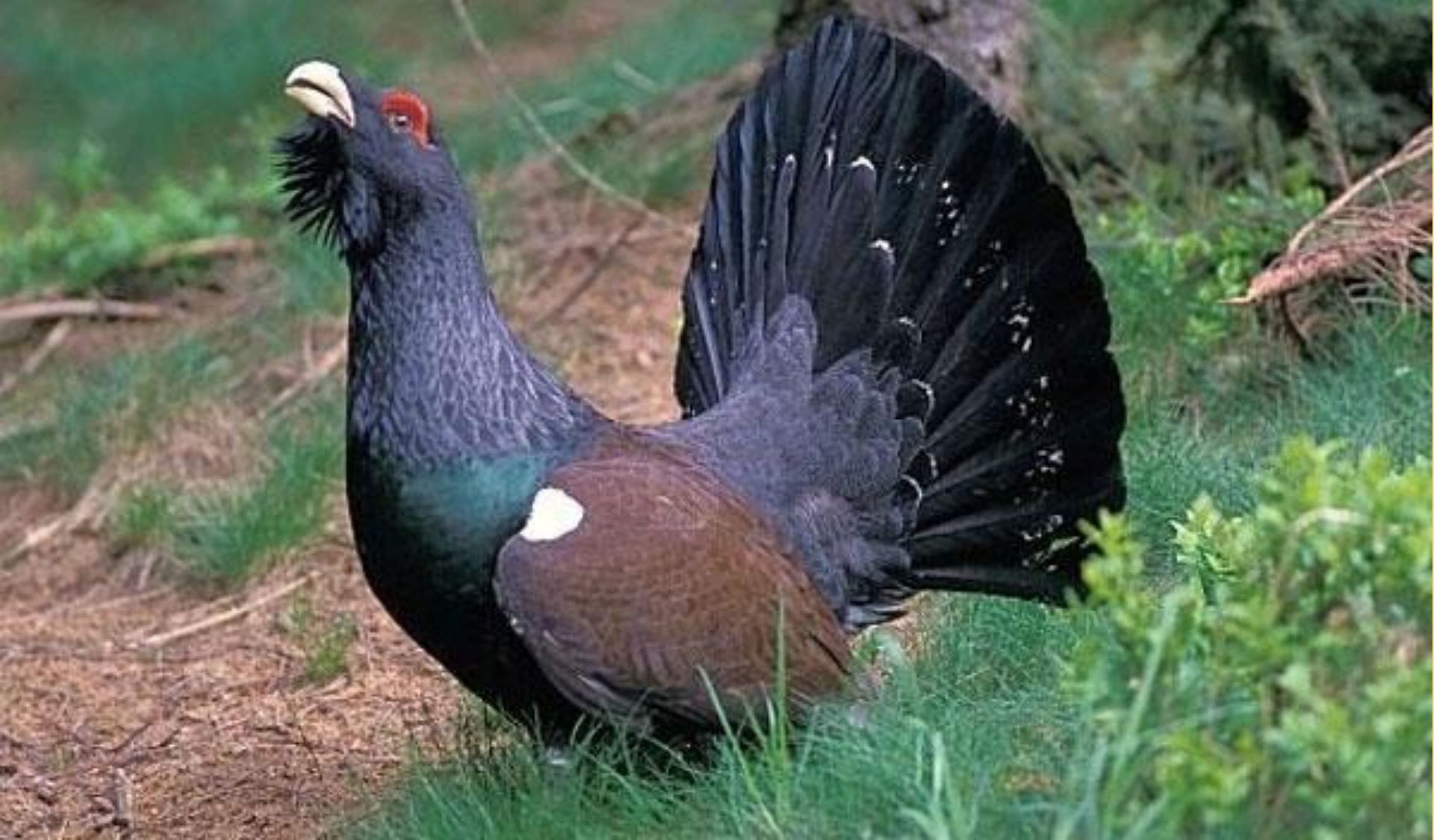
Государственный природный заказник «Александровский» Каменный глухарь