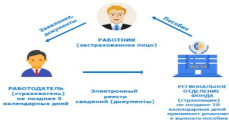
Схема выплаты пособий ПОСЛЕ 1 января 2021 года