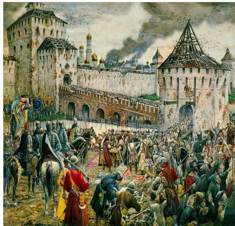
Э.Э.Лисснер «Изгнание поляков из Московского кремля»