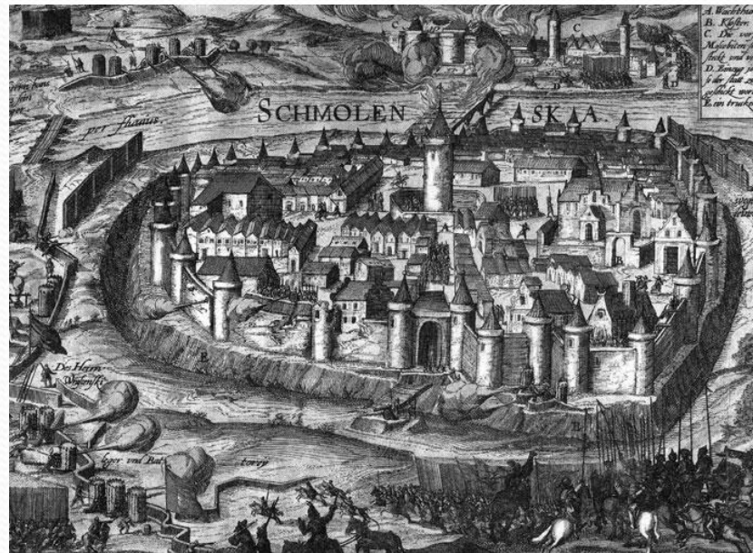
«Осада Смоленска. 1609-1611 гг.» (гравюра XVII в.)