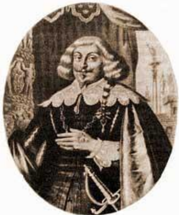
Королевич Владислав. (Гравюра XVII в.)