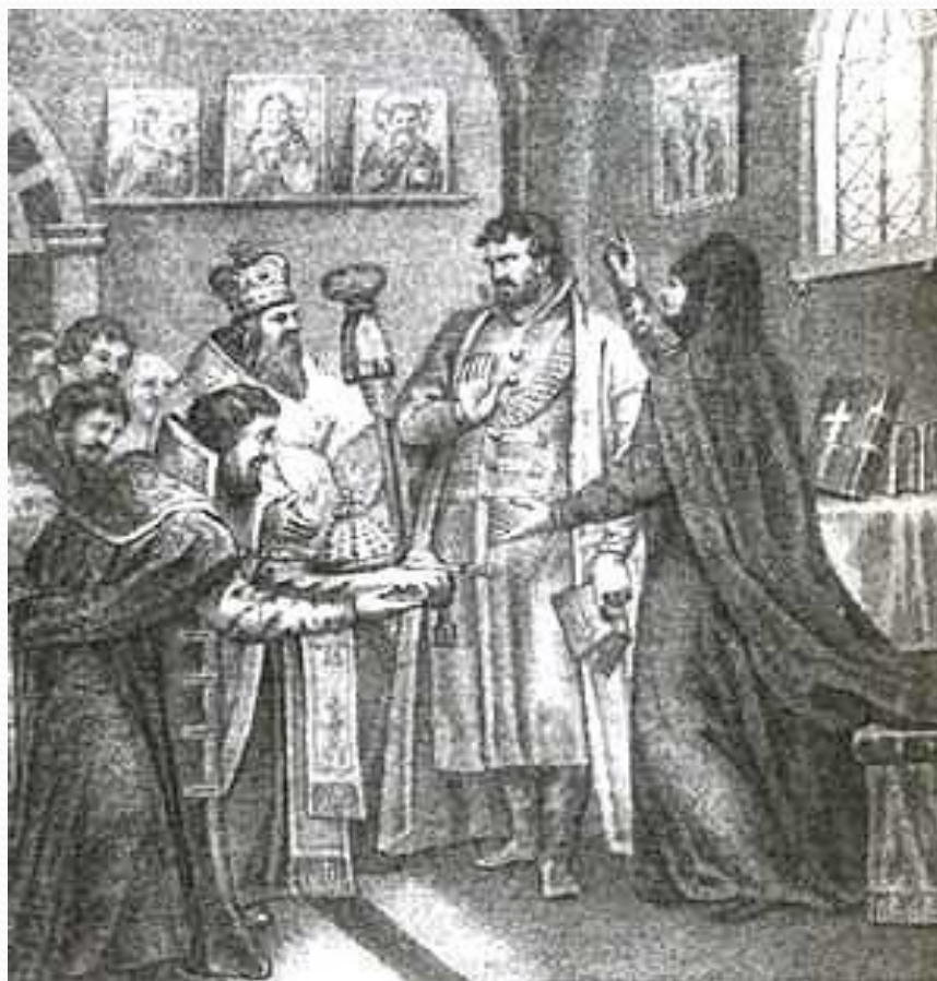
«Избрание Бориса Годунова на царство». Гравюра XIX в.

В 1598 г. Земский собор – собрание выборных представителей от российских сословий избрал царём Бориса Фёдоровича Годунова – ближайшего помощника царя Фёдора Ивановича. Но правление его сложилось неудачно.