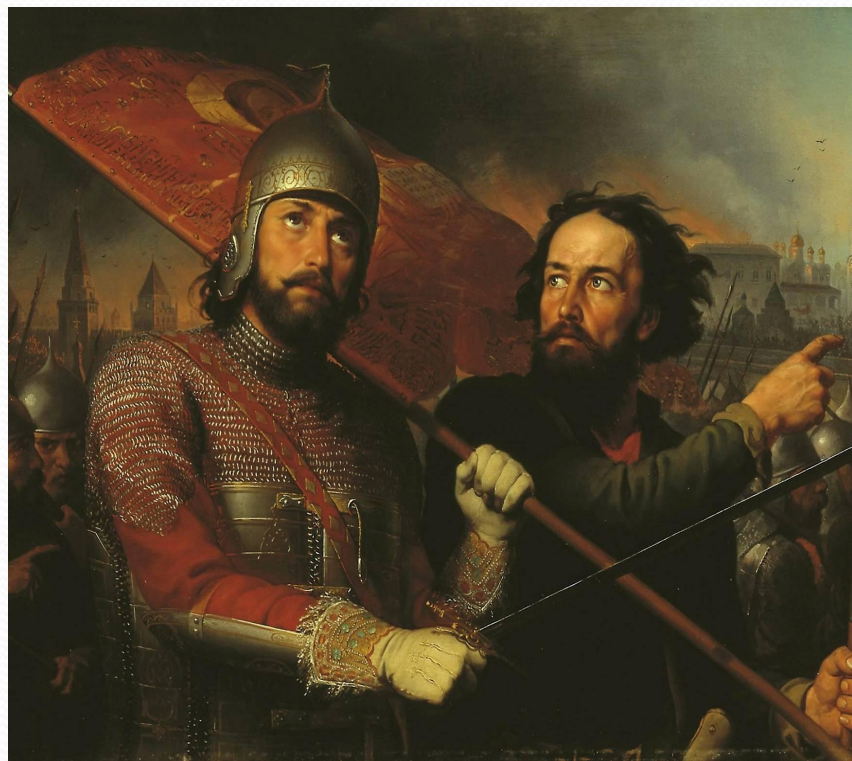
М.И.Скотти «Минин и Пожарский»

В апреле 1612 г. в Ярославле было создано патриотическое правительство – «Совет всей земли»