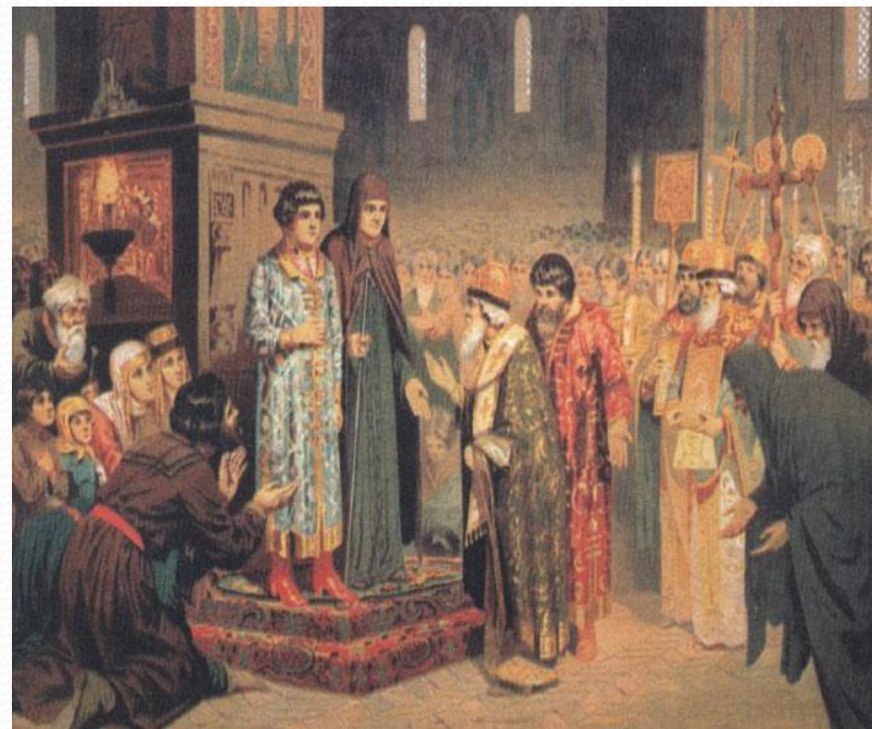
А.Д.Кившенко «Первый Романов»