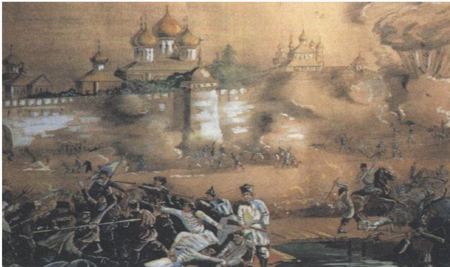
Неизв. худ. «Осада ополченцами Кремля»