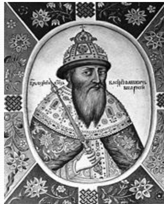
«Царь Василий Шуйский» (миниатюра XVII в.)