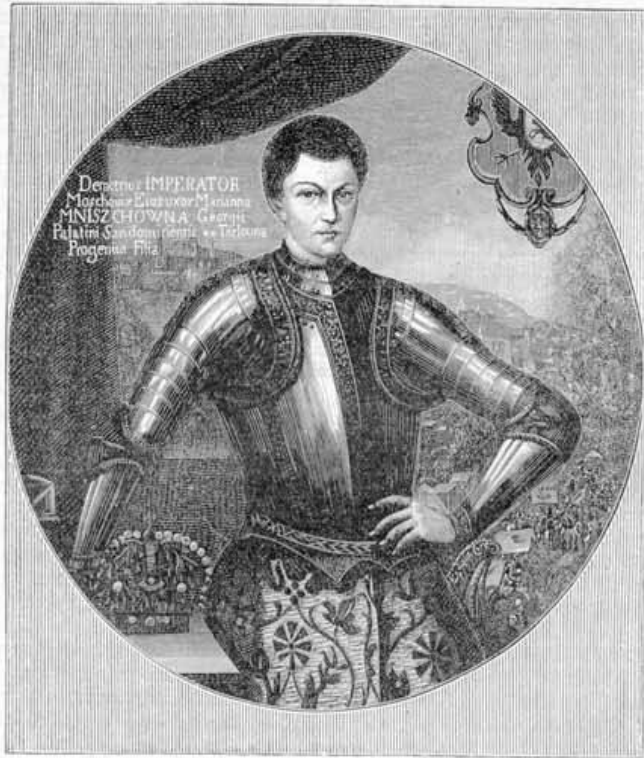
«Лжедмитрий I» Гравюра XVII в.

Народным недовольством правления Бориса Годунова попыталось воспользоваться Польское королевство.