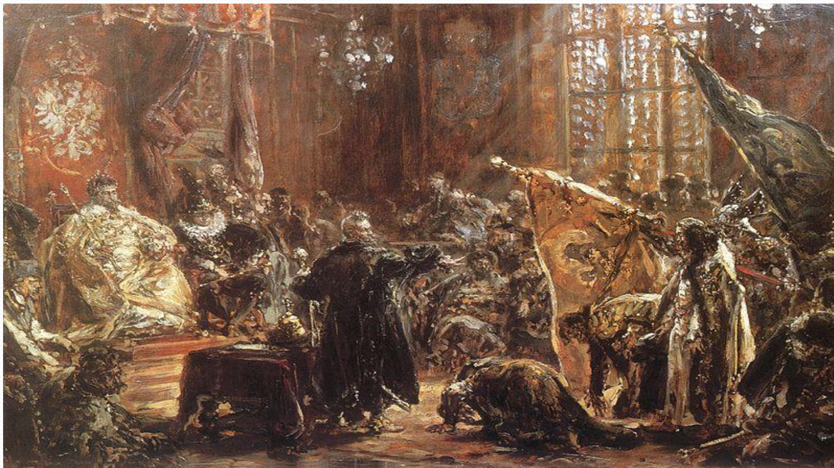
Я.Матейко «Представление пленного царя Василия Шуйского Сигизмунду III»

Весной 1610 г. вскоре после разгрома Тушинского лагеря Михаил Скопин-Шуйский умер