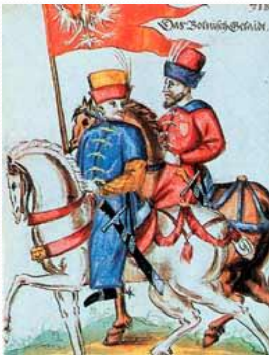
«Польские всадники» (рис. XVII в.)