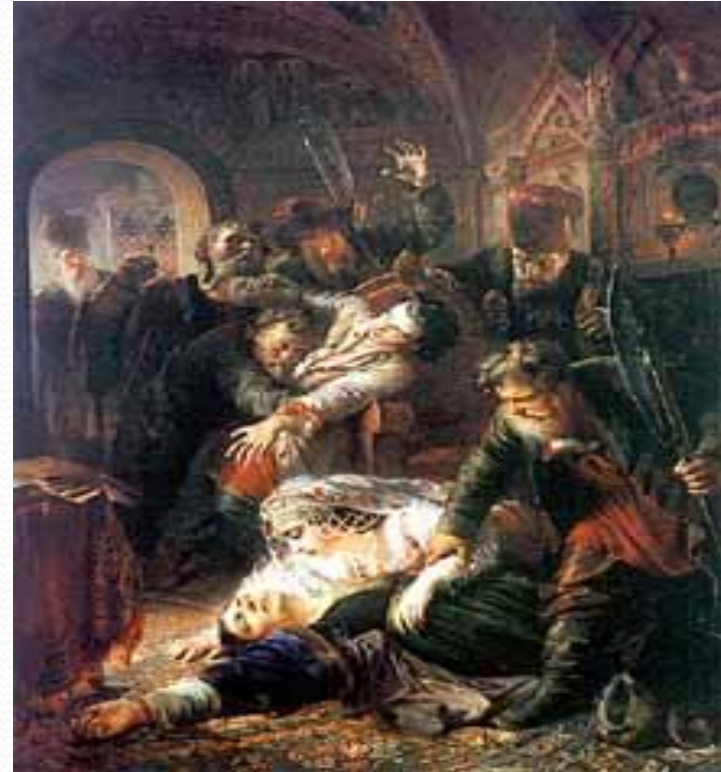
К.Е.Маковский «Убийство Фёдора Годунова агентами Лжедмитрия»