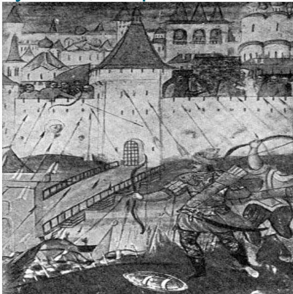
«Осада шведами Новгорода. 1611 г. (Деталь иконы XVII в.)»