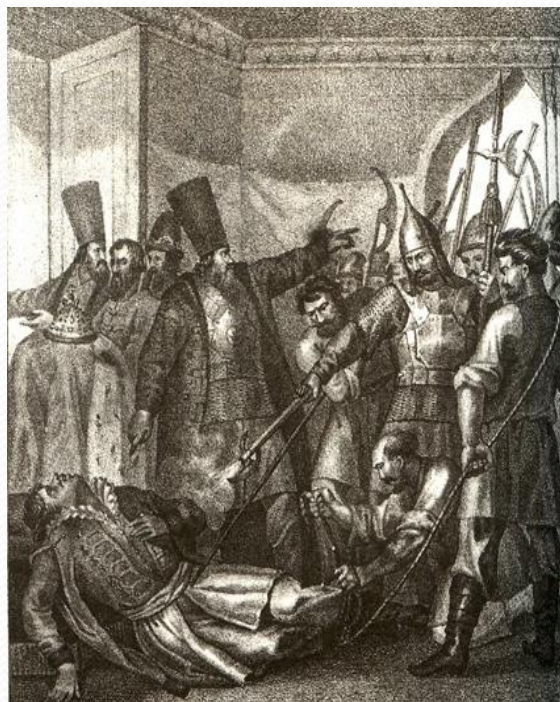
«Смерть Лжедмитрия I» (гравюра XIX в.)