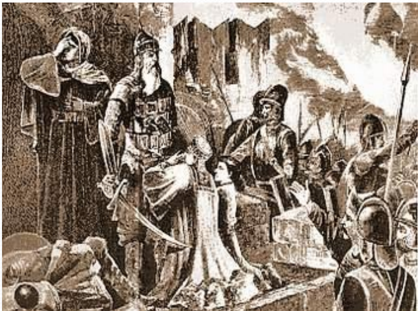
«Польский король Сигизмунд III» (гравюра XVIIв.)