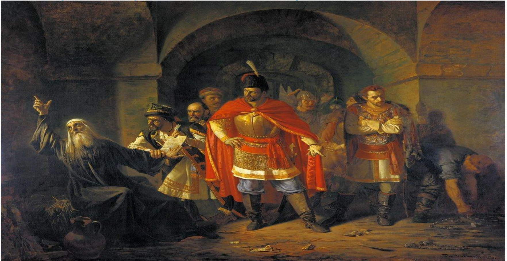
П.П.Чистяков «Патриарх Гермоген отказывает полякам подписать грамоту»