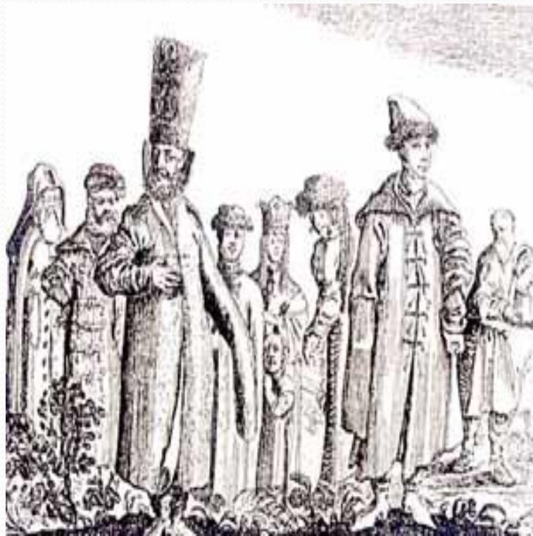
Московские бояре. (Гравюра XVI в.)