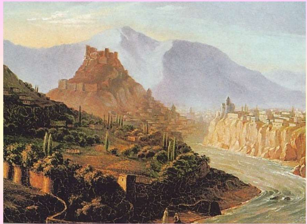
Вид Тифлиса. Картина М.Ю. Лермонтова. 1837г.

За написание стихотворения "Смерть поэта" скандальный писатель был отправлен в ссылку на Кавказ. Там же было написано известнейшее произведение "Бородино". Благодаря бабушке после первой ссылки Лермонтов восстановлен на службе и отправлен в Санкт Петербург.