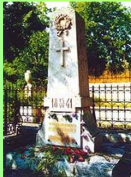
Первоначальное место погребения