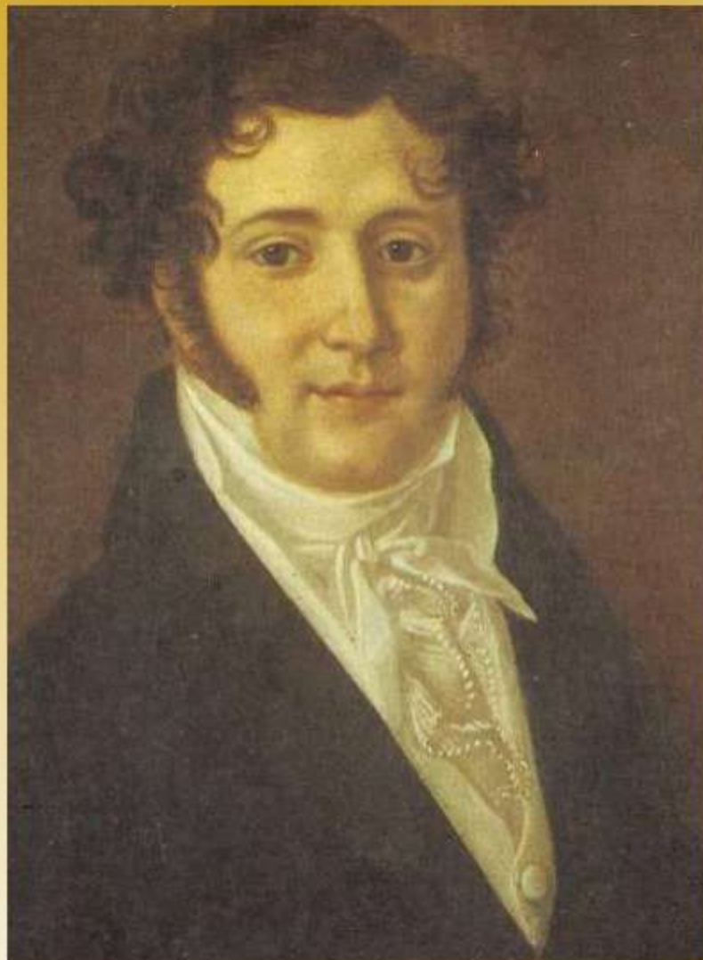
Юрий Петрович Лермонтов, отец поэта.