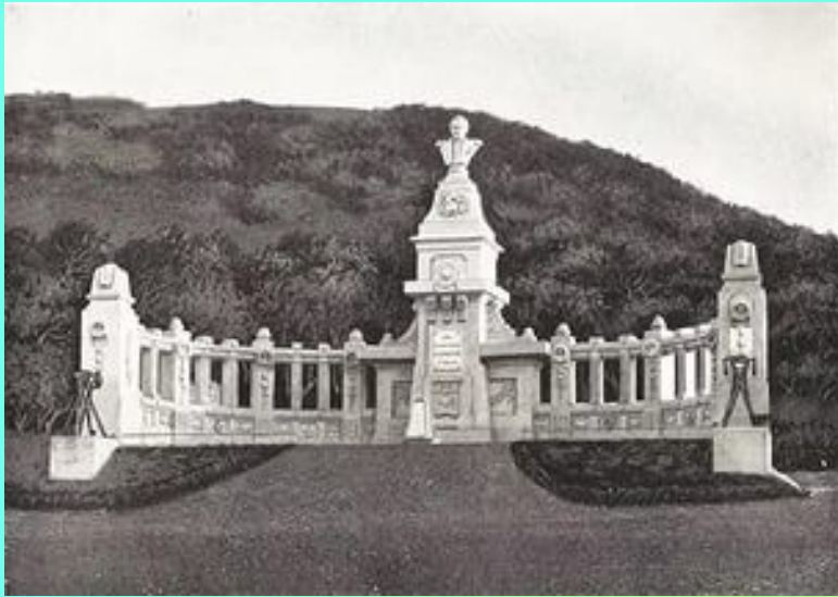
Место дуэли в Пятигорске