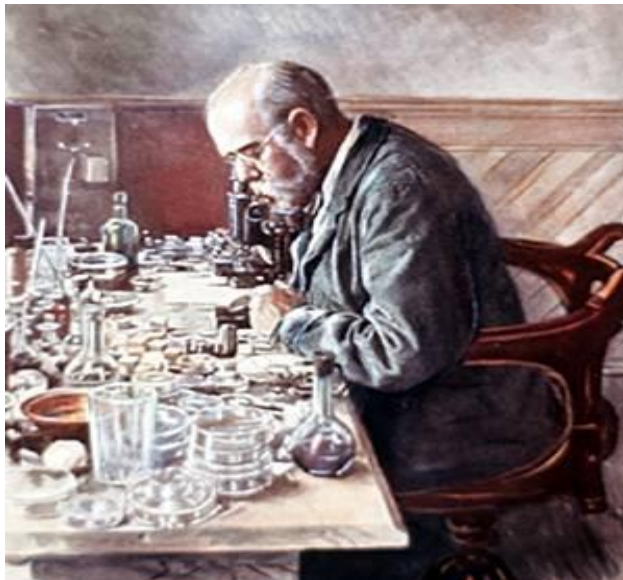
Роберт Кох (1843 - 1910)

Неміс дәрігері-микробиолог. Бактериологияның негізін салушы,