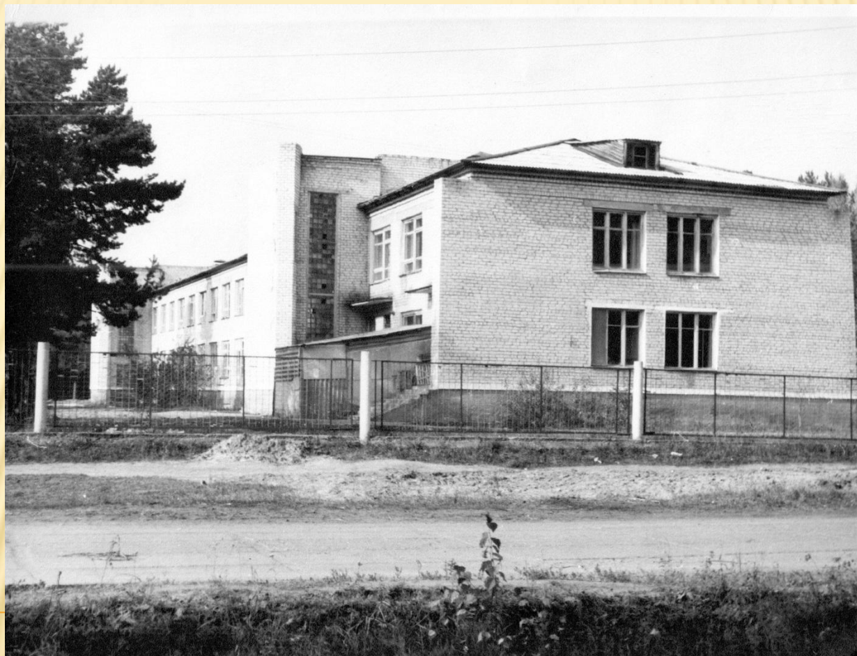
Снимок сделан в 1986 году. (Ф.1Ф. Оп.2.Д.35)