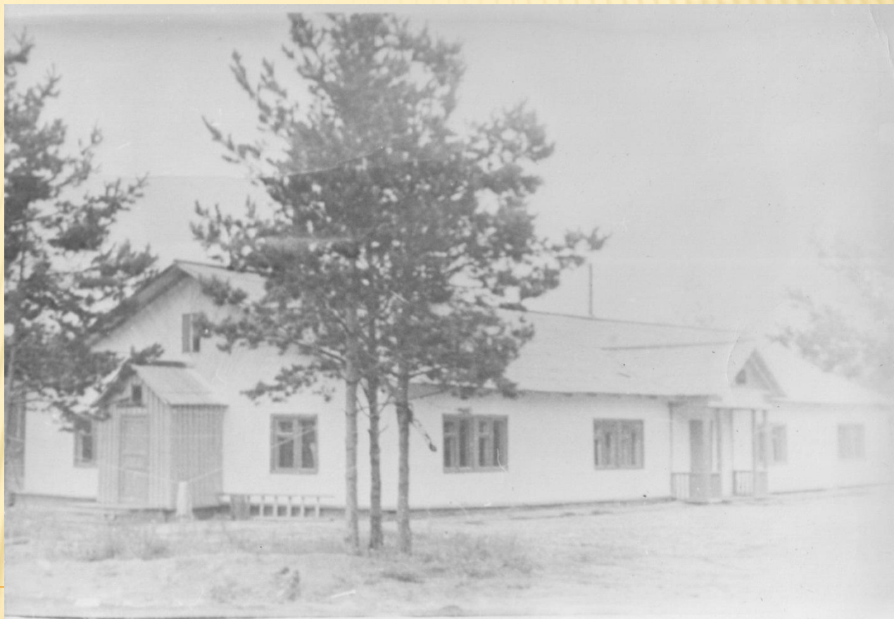
Снимок сделан в 1970 году. (Ф.1Ф. Оп.2.Д.34)

Из истории поселка: ... Поселок основан в 1967 г. торфодобытчиками. Жили они поначалу в вагончиках, а первыми постройками стали баня и общая печь на улице... (Тюменский район вчера и сегодня. Сборник материалов. – Тюмень. 1993 - Л.24)