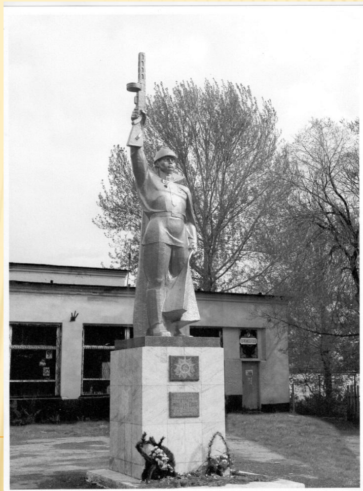
Снимок сделан в 2003 году. (Ф.1Ф. Оп.1. Д.152)

Из истории поселка: ...В начале 20 века на месте поселка стояли лишь будка стрелочника да служебные постройки – в 1910-1913 гг. шло строительство железнодорожной ветки Тюмень-Омск, и на одном из отрезков пути был построен разъезд, из которого и вырос будущий поселок... (Тюменский район вчера и сегодня. Сборник материалов. – Тюмень. 1993 - Л.42)