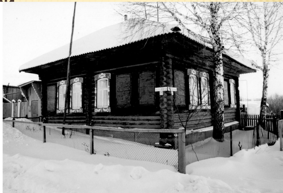
Снимок сделан в 2003 году. (Ф.1Ф. Оп.1.Д.11)

ДОМ ЛАВОЧНИКА КОЛОКОЛЬНИКОВА, ПОСТРОЕННЫЙ В КОНЦЕ XIX ВЕКА. ЗДАНИЕ ДЕТСКОГО САДА ДО 1975 ГОДА. ПОСЛЕ ЖИЛОЙ ДОМ. С. ПЕРЕВАЛОВО, УГОЛ УЛ. СОВЕТСКОЙ, УЛ. САДОВОЙ