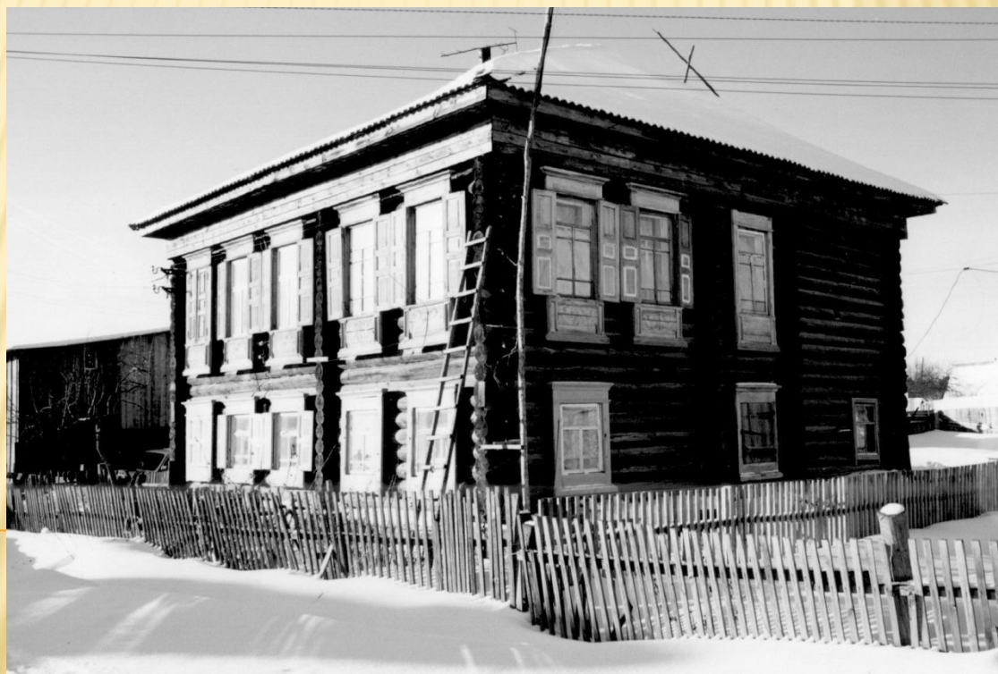
Снимок сделан в 2003 году. (Ф.1Ф. Оп.1.Д.9)

ЗДАНИЕ ПОСТРОЕНО В XVIII ВЕКЕ. ДО 1960 В НЕМ РАСПОЛАГАЛАСЬ ПЕРЕВАЛОВСКАЯ БОЛЬНИЦА. ПОЗЖЕ ИСПОЛКОМ ПЕРЕВАЛОВСКОГО СОВЕТА НАРОДНЫХ ДЕПУТАТОВ. С 1983 ГОДА ЖИЛОЙ 4 КВАРТИРНЫЙ ДОМ. С. ПЕРЕВАЛОВО, УЛ. СОВЕТСКАЯ