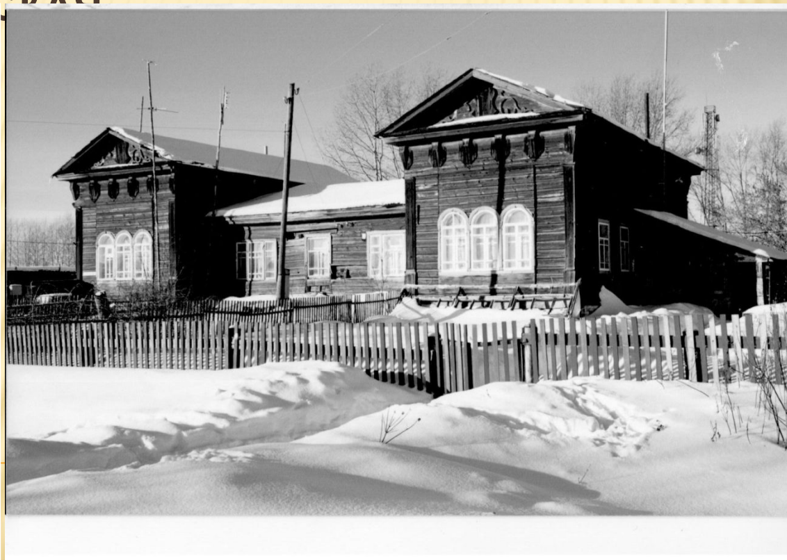
Снимок сделан в 2003 году. (Ф.1Ф. Оп.1.Д.10)