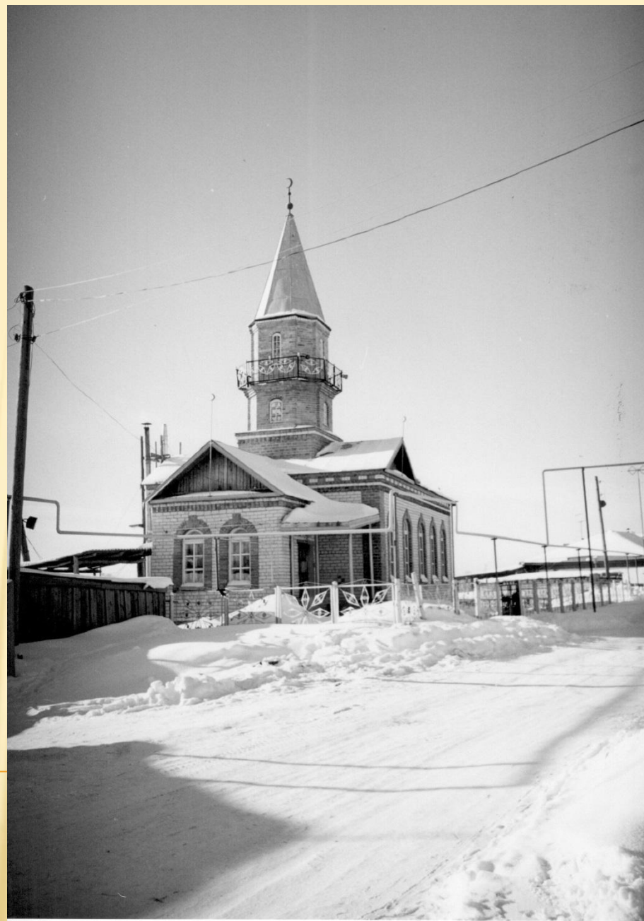
Снимок сделан в 2002 году. (Ф.1Ф. Оп.1.Д.56)

(Тюменский район вчера и сегодня. Сборник материалов. – Тюмень. 1993 - Л.29)