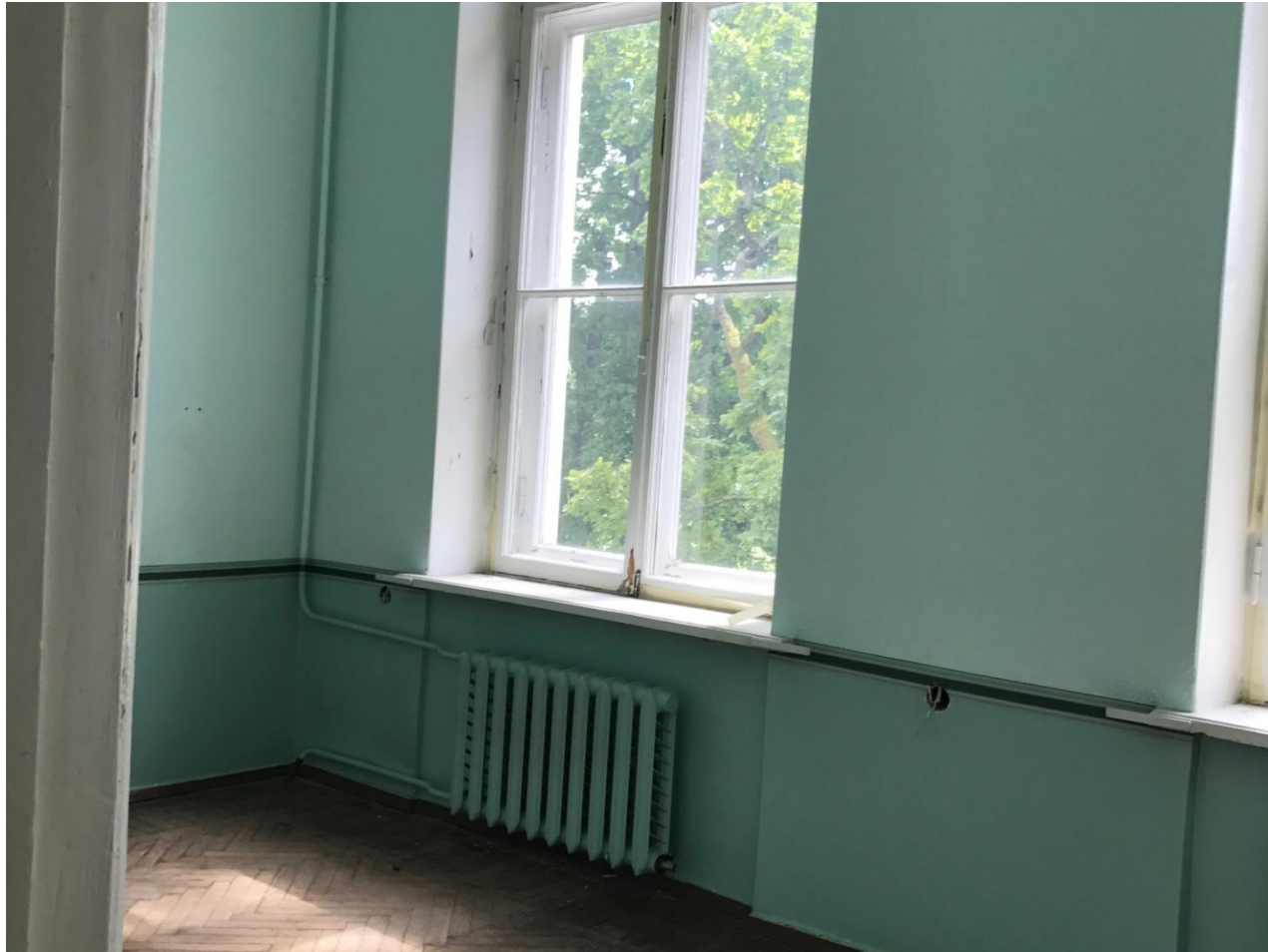
Состояние гостиничного номера сегодня