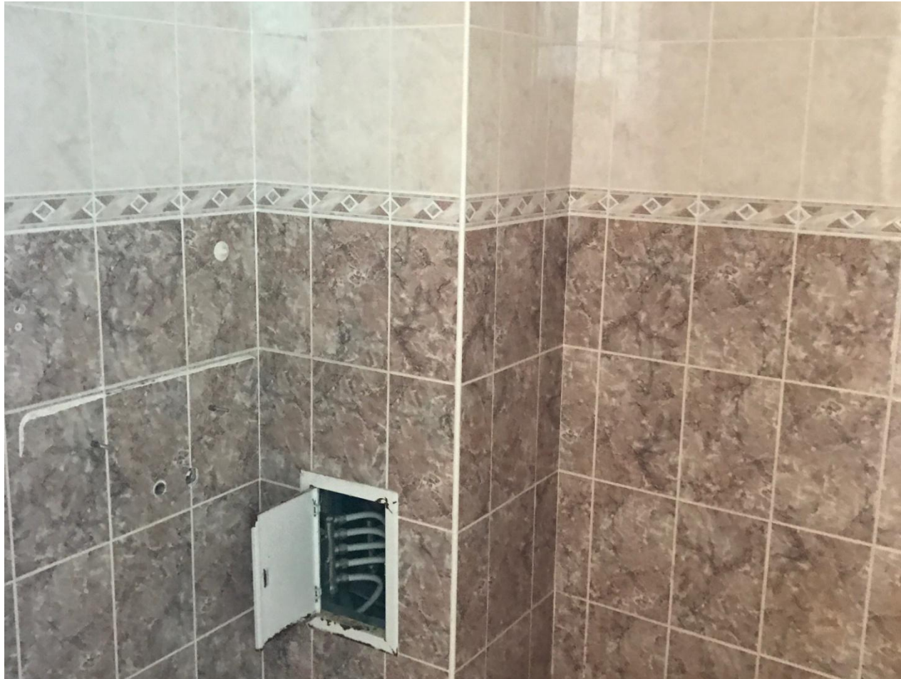
Современное состояние ванной комнаты