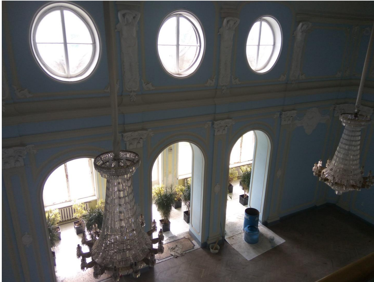
Вид большого зала сейчас