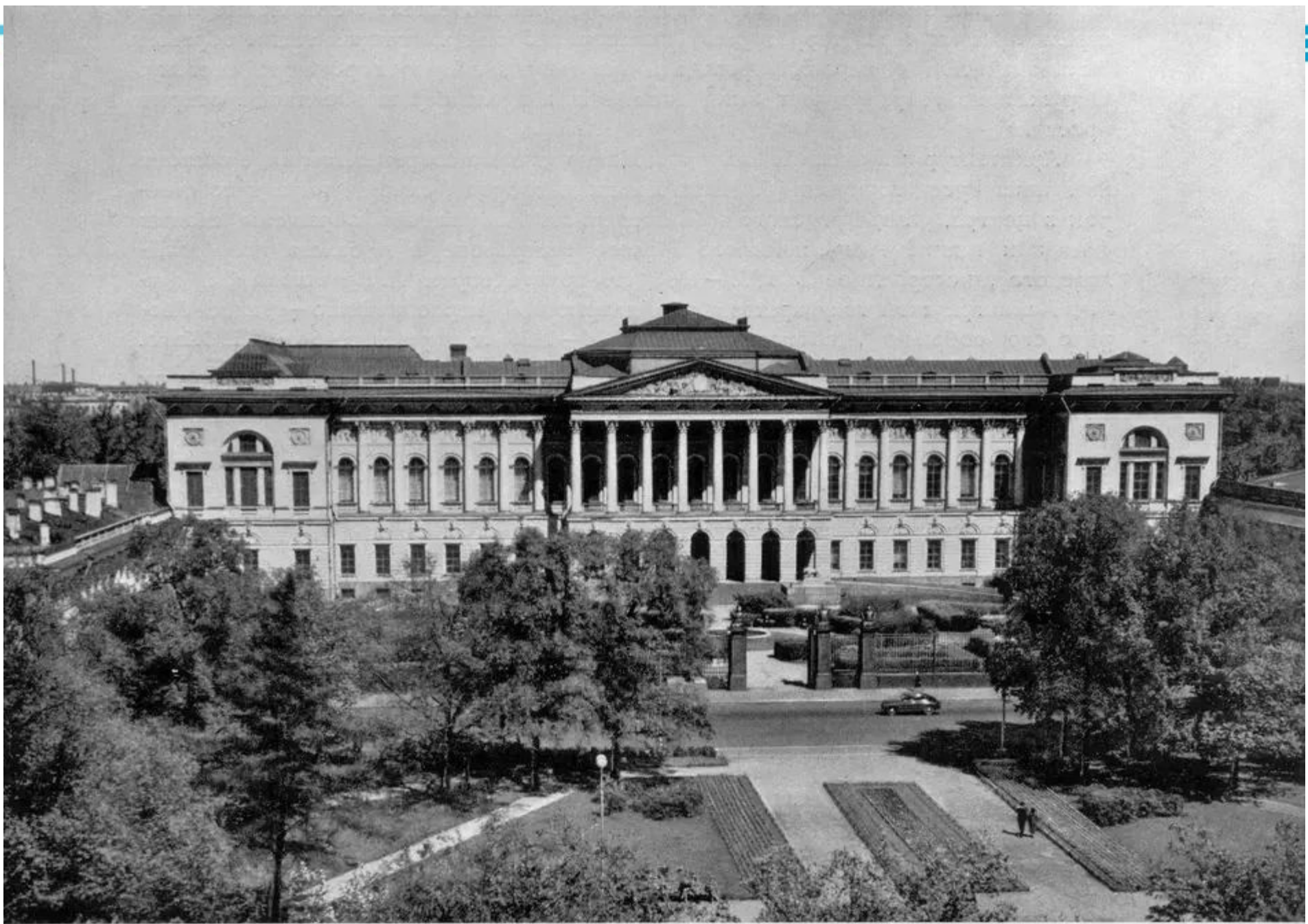
Русский музей (б. Михайловский дворец)