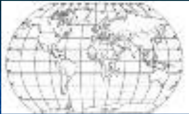
КОНТУРНАЯ КАРТА ЗЕМНОЙ ПОВЕРХНОСТИ