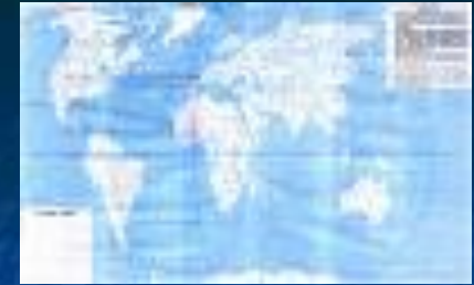
ГЛОБУС И КАРТЫ РАЗЛИЧНОГО ВИДА ДЛЯ ИЗУЧЕНИЯ ПОВЕРХНОСТИ ЗЕМЛИ

Для описания и исследования одного и того же объекта может использоваться несколько моделей