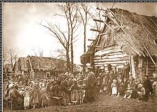
Благотворительная столовая в деревне во время голода