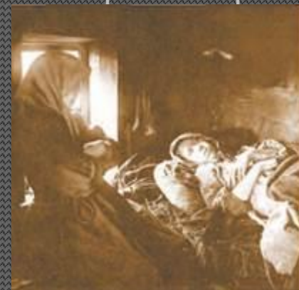
Больные тифом во время голода