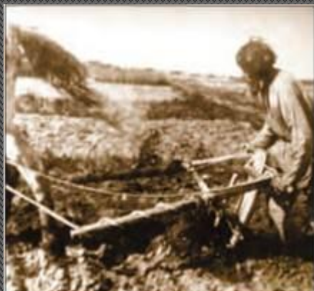
Крестьянин с сохой

Многоукладность сельского хозяйства России продолжала острые конфликты внутри общества.