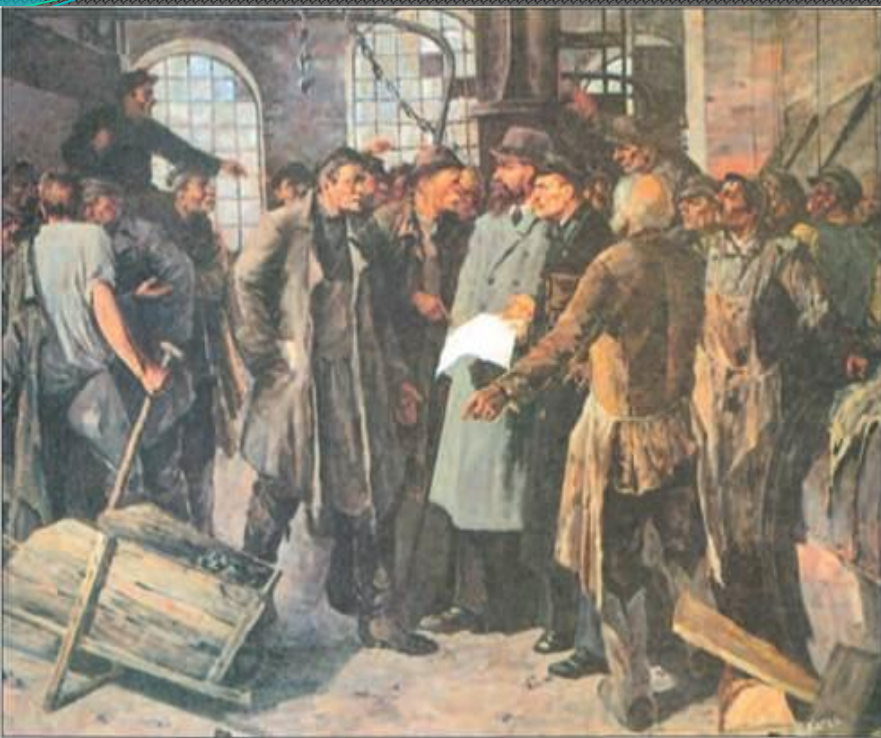
Стачка на металлургическом заводе